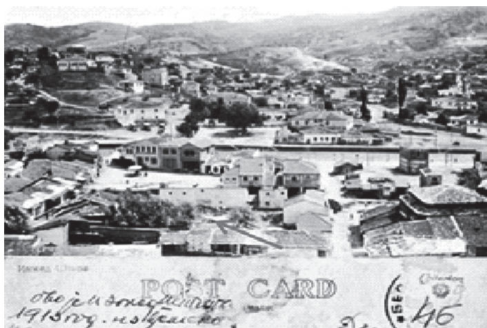
Поштенска картичка од 1913 година на која се гледа местото каде што се наоѓала Шардаван џамиси во 1911 година

на недолжниот народ. Со секири, ножеви, мотики и стапови удирале каде ќе стигнат и за кусо време веќе било пролеано многу крв.