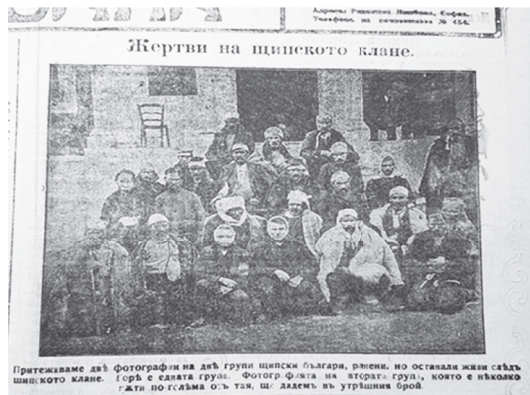
В. Камбана, бр. 1456, 25 јануари 1912 година 25

бил дека месната власт можела да го спречи колежот. Исто така, комисијата утврдила неточности во известувањето за настанот во некои дневни весници. Имено, пишувањето на еден солунски весник дека Евреите учествувале во аферата, кое потоа било пренесено од некои грчки и ерменски весници во Цариград, било неточно. Напротив, голем број Евреи им пружиле засолниште на гонетите. На комисијата ѝ бил приложен список од 121 „Бугарин“ прибрани кај Евреите. Имало четворица-петмина такви кои биле компромитирани кај населението, но таа бројка е незабележителна во однос на оние што пружиле помош. Исто така, во извештајот на комисијата стои дека и неколку турски семејства им помогнале на Македонците и ги засолниле кај себе. 24