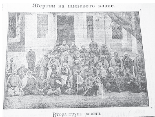
В. Камбана, бр. 1457, 26 јануари 1912 година

Првата фотографија од настанот била објавена во софискиот весник Камбана . Редакцијата на 25 и на 26 јануари 1912 година еднопосредно објавила две различни фотографии на дел од ранетите кои лежеле во турското школо.