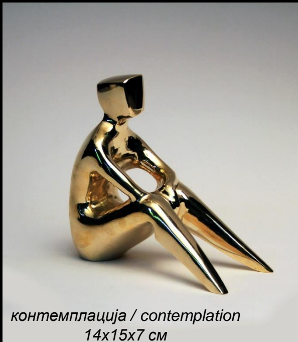
контемплација / contemplation 14x15x7 см

Учесник е на повеќе меѓународни симпозиуми во рамките на кои реализира монументални скулптури и групни изложби во Австрија , Словенија, Босна и Херцеговина, Хрватска, Србија, Турција и Индија, Добитник е на наградата за скулптура „Димо Тодоровски“ од ДЛУМ во 2008г. и 2017г.