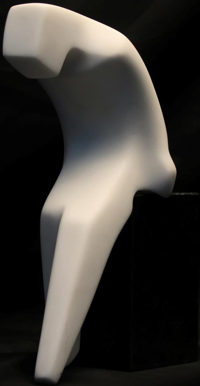
на работ / on the edge 22 x 13 x 9 cm