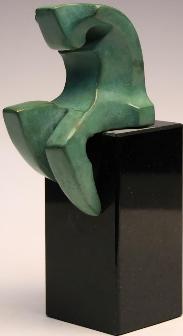
меланхолија / melancholia 13 cm

Издавач НУЦК „МАРКО ЦЕПЕНКОВ“ ПРИЛЕП Фотографии Тоше Ристов печати: