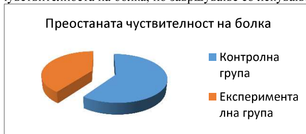
Дијаграм бр. 1 Чувствителност на болка кај пациентите од двете групи Diagram no. 1 Sensitivity to pain in patients from both groups

На дијаграм 1 е прикажана чувствителноста на болка, по завршување со лекувањето кај двете групи.