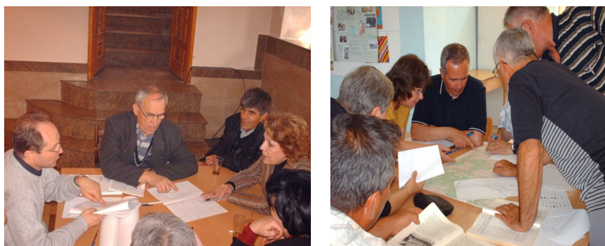
Слика 1. Планирање и подготовка на наставниците за теренската настава