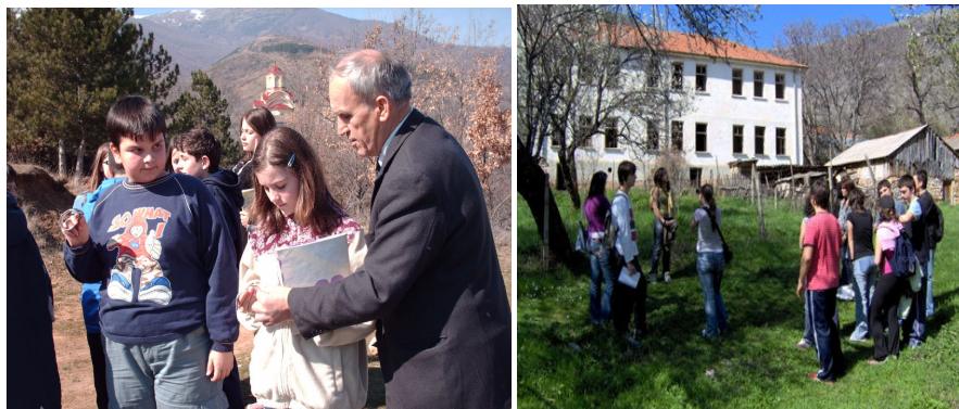
Слика 2. Реализација на теренската настава со ученици