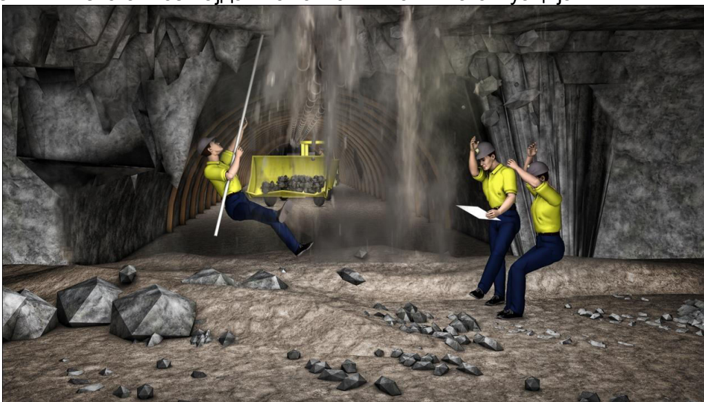
Слика 1. Визуелно прикажување на зарушување во подземните рударски простории

Исто така добро изработена визуализација на реконструкција на некоја несреќа која се случила во рударството или пак реконструкција на несреќа по дадено сценарио, може да има клучна позитивна улога врз работниците ако тие хипотетички некогаш се најдат во таква или слична ситуација.