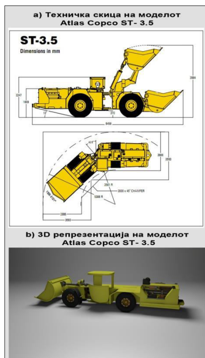
Слика 3. Приближно 3D моделирање на Atlas Copco ST-3.5

Комплексноста за изработка на самата визуализација зависи од сцената и објектите кои се зафатени од проблематиката која треба да се визуализира. На пример, при визуализација на дадена катастрофа во рудник за подземна експлоатација, сцената која треба да се претстави може да има една или повеќе машини кои исто така треба да се претстават, а воедно се премногу комплексни за да се моделираат, па затоа во вакви случаи не се обрнува премногу внимание при моделирањето на ваквите машини, туку се оди на нивно приближно моделирање во однос на нивниот реален изглед.