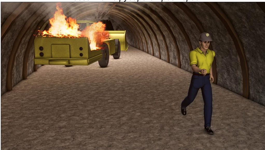
Слика 2. Визуелно прикажување на пожар (експлозија) во подземните рударски простории