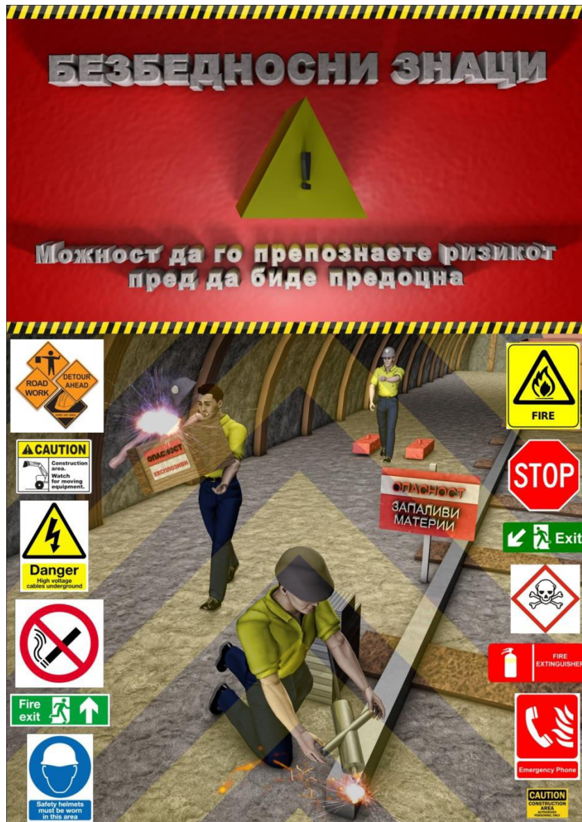
Слика 5. Изработка на постер за значењето на безбедносните знаци