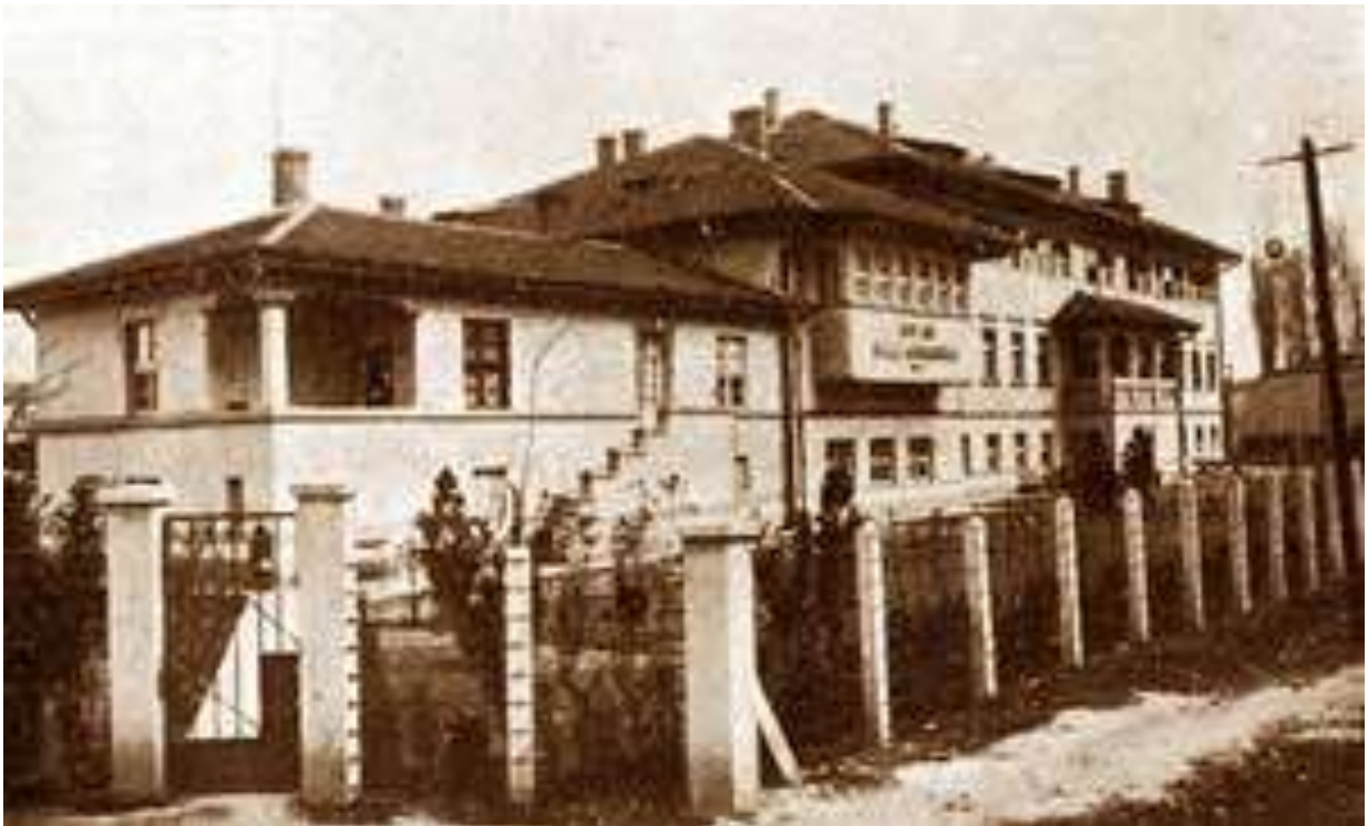
Дечји дом „Ета Греј“ у Скопљу 7

You take the train from Calais, in a through compartment, with wagon-Nits , travel through France via Paris, Switzerland via Lausanne, Italy via the Lake of Maggiore, Milan and Venice, and on through Jugo-Slavia to Belgrade. It is the easiest and most comfortable journey known, and certainly one of the most picturesque. Arrived at Belgrade I had some days to wait until someone else could accompany me on yet another journey to Macedonia. This was not so comfortable or not so easy running. In many parts the railway lines were being repaired, we had many stopping places, and had to stay the night in Skoplyi, as there was no train running direct to Veles. The memories of that night are not pleasant. It was hot August weather; there were many mosquitoes and many bugs, so that though the town itself had many interesting people, and interesting buildings and places, the least said the soonest forgotten! It was dirty—distinctly dirty!