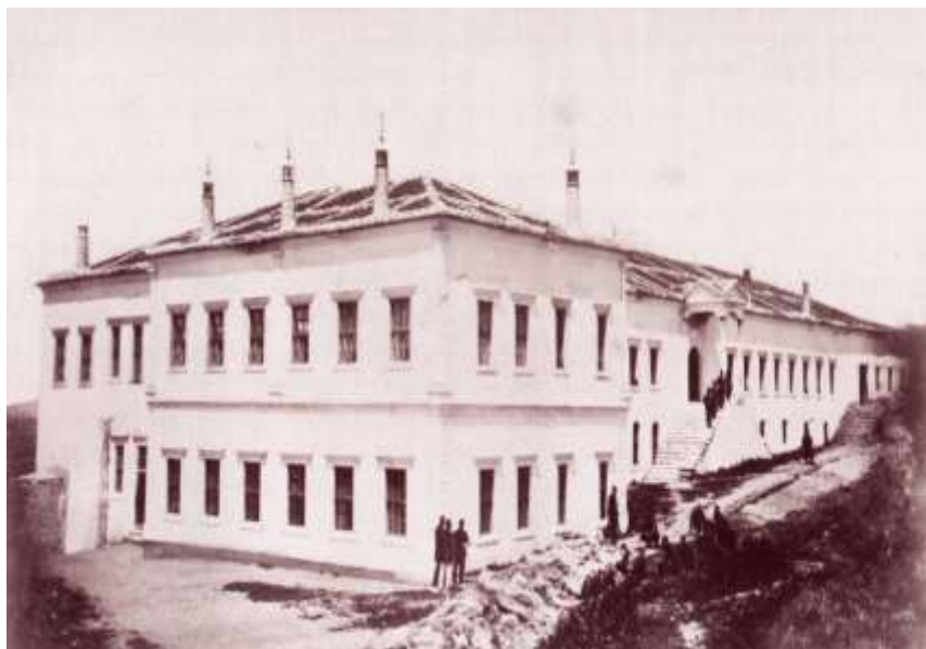
Болница Леди Пеџет у Скопљу 1919 год.