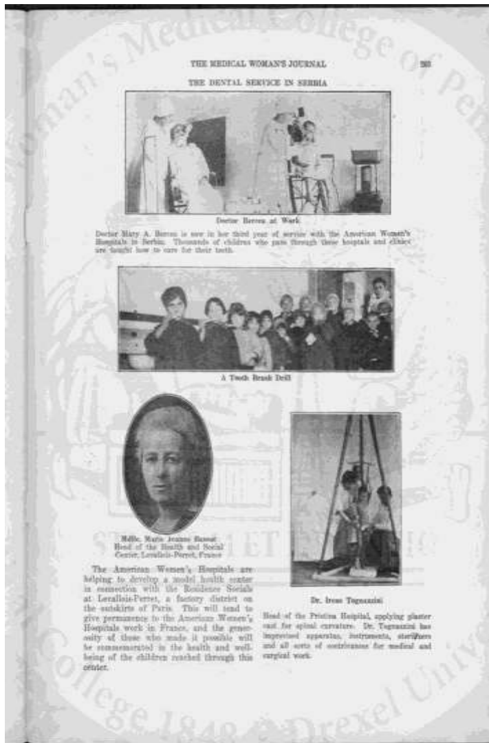
Брига за дентално дечје здравље 8