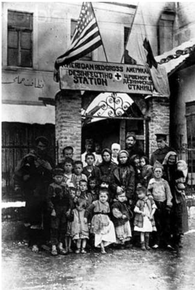
Дезинфекциона станица Америчког Црвеног крста у Струги

То је био велики проблем за једну новостворену и до темеља разрушену државу, у којој је тек требало формирати непостојећи систем дечје заштите. Оснивањем педијатријских институција у Македонији, уз помоћ Министарства народног здравља Краљевине СХС, Америчког црвеног крста и санитетских мисија америчких и шкотских жена и мисије Српски потпорни фонд, спашено је од сигурне смрти, неколико хиљада несрећне деце.