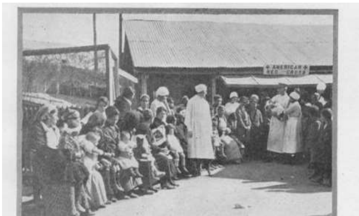
Дечји диспанзер Америчког црвеног крста у Велесу 1919 год. 5