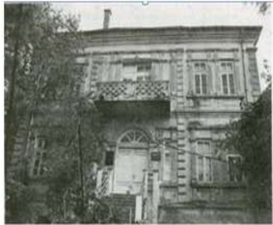
Зграда бивше Војне болнице у Велесу у којој је била смештена Прва дечја болница у Македонији

The Children's Hospital at Veles is a remarkable place. This hospital would be a credit to New York City. The building is large. By putting cots in the halls it is possible to care for as many as two hundred children. There were between 150 and 200 there at the time of my visit. It is a pity that Veles is difficult to reach, and for this reason comparatively few people are able to see this hospital. It is the largest, best equipped hospital for children in all Jugo-Slavia.