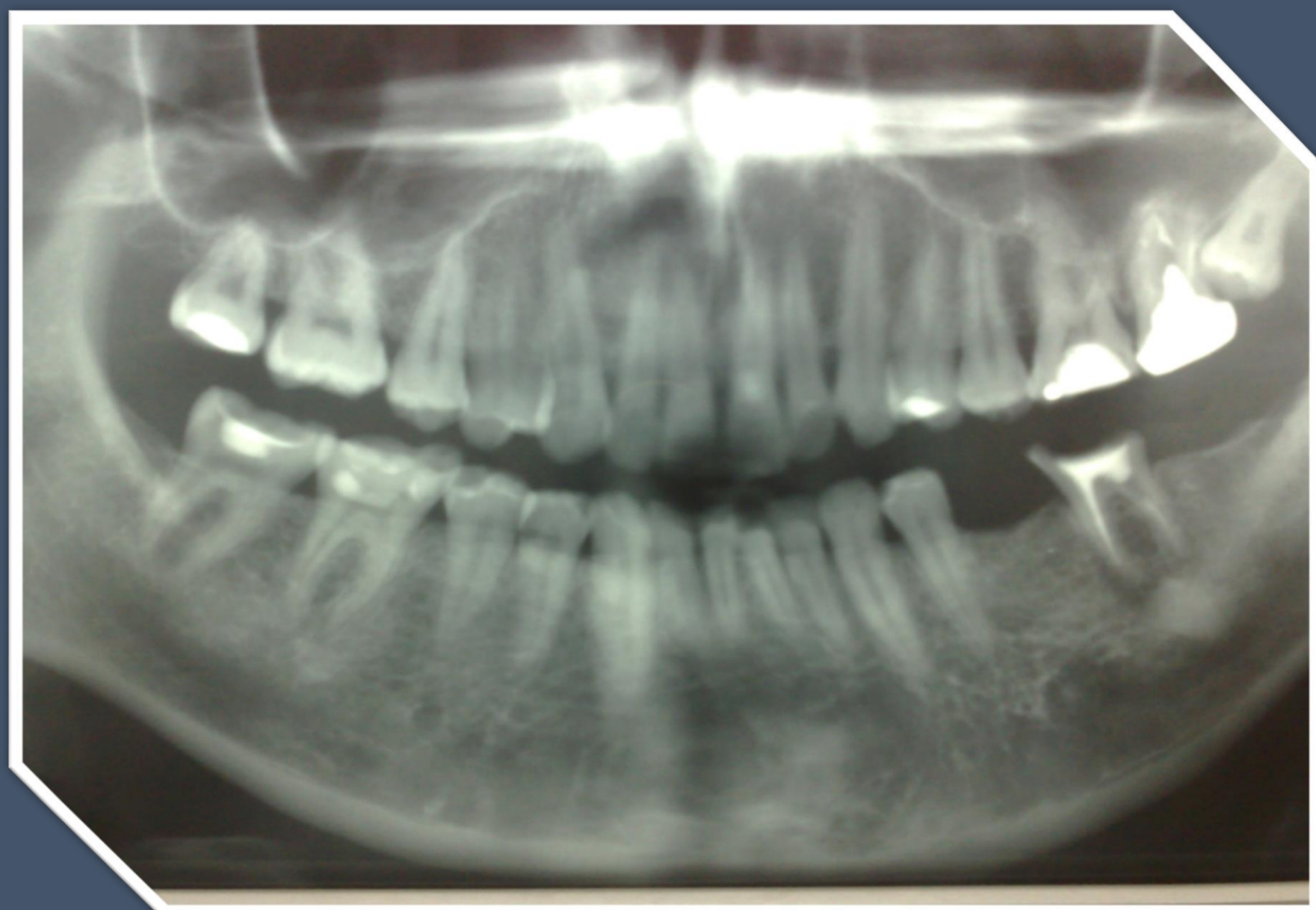
Панорамска РТГ-Слика пред екстракцијата

РЕЗУЛТАТИ- После 6 месеци од екстракцијата, поставени се три дентални импланти соодветно на место 35, 36 и 37 и прилагодено според условите. После 4 месеци од оваа интервенција направена е импланто-протетска рехабилитација.