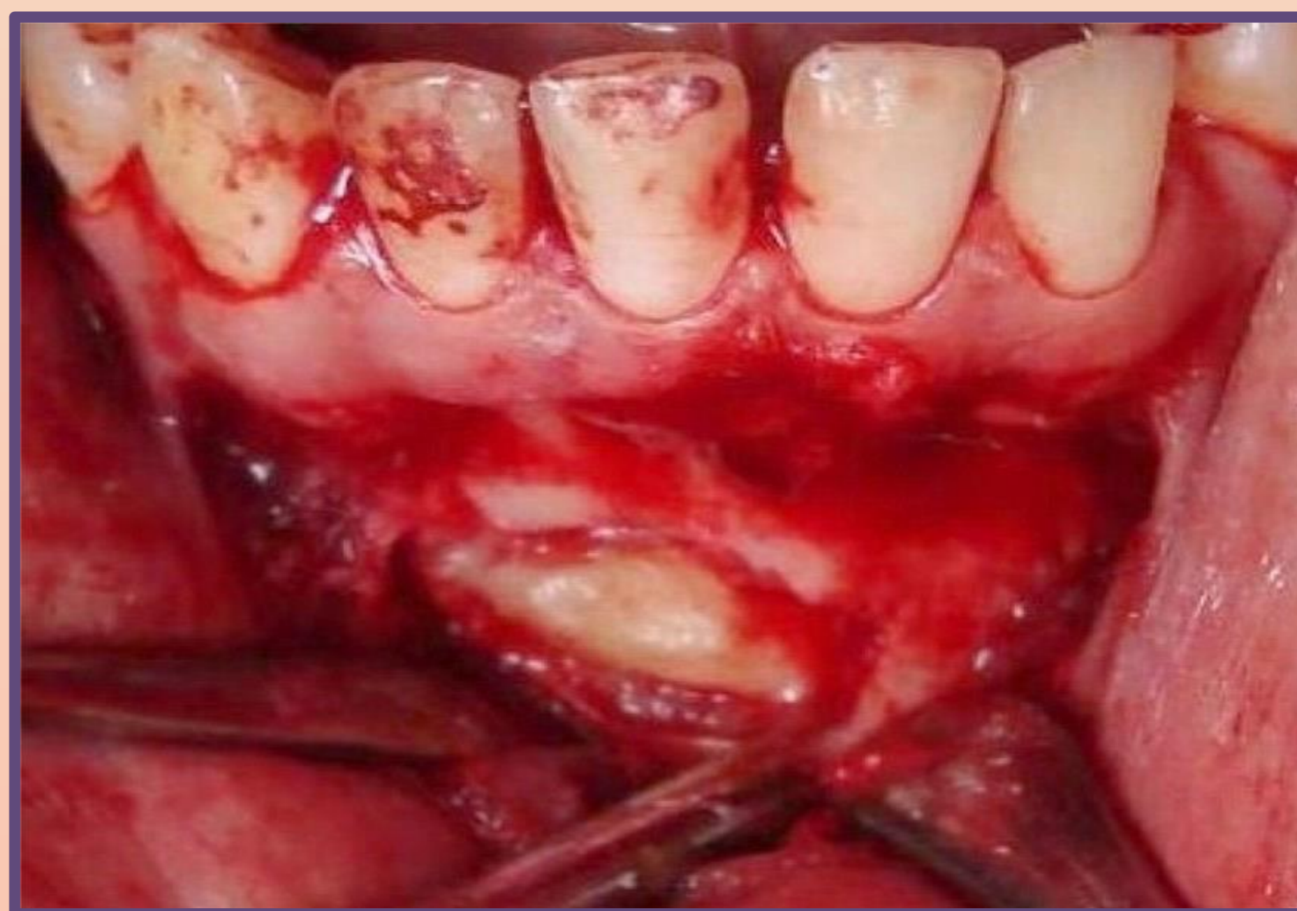
Инцизија, мукопериостеално ламбо, остеотомија и експозиција на трансмигрираниот канин.