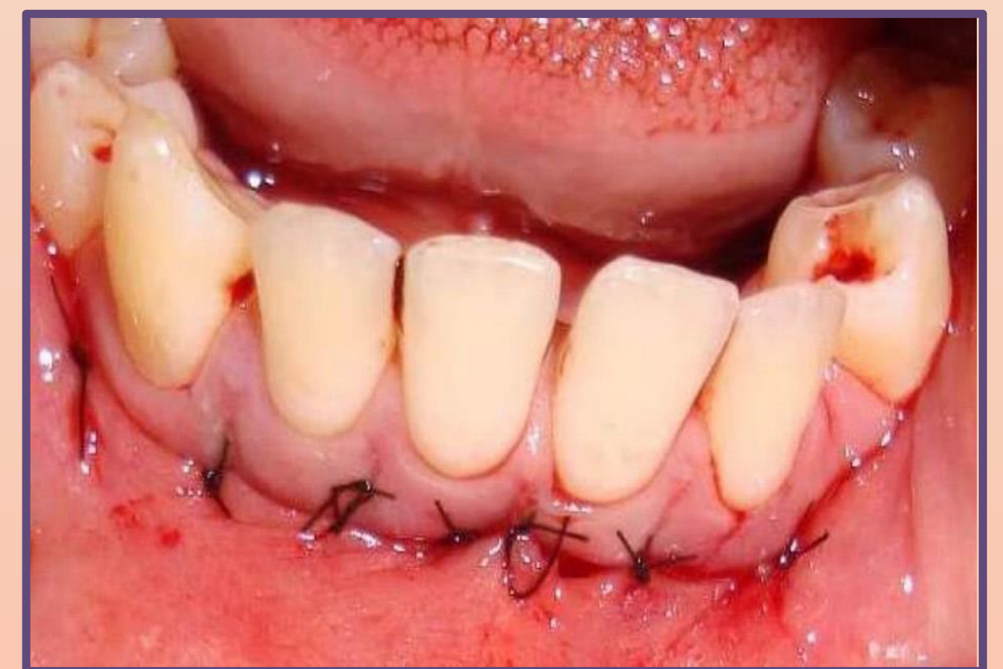
Сутурирање на мукопериостеалното ламбо по екстракција на трансмигрираниот мандибуларен канин.