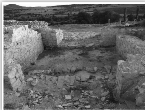
Сл. 5 - Североисточна порта снимена од североисток Надворешен и внатрешен влез во портата

Портата е откриена со систематските археолошки истражувања во 2008 и 2009 година 17 . Портата е сместена е во северозападниот дел на североисточниот одбранбен ѕид, меѓу кулите 7 и 8. Растојанието од кула 7 е на 18 м, а од кула 8 е помало и изнесува 15. Овие растојанија биле доволни за да биде портата бранета од истурените кули (сл.5).