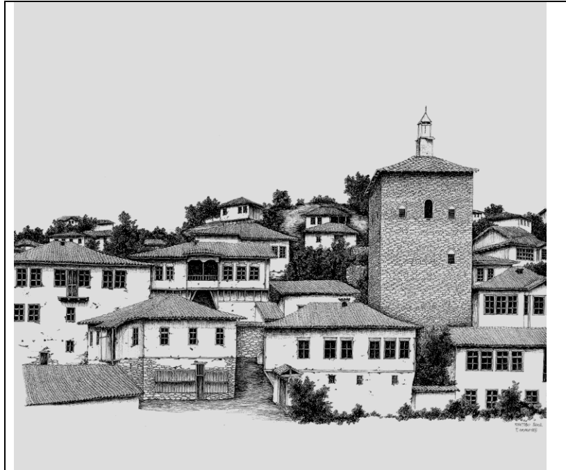
1,Изглед на дел од градот со кула, Кратово, почеток на 20-от век View of the part of town with a tower, Kratovo, beginning of 20 century

Кратово во историските документи се споменува како значаен рударски центар врз кој се базирал целокупниот економски развој на градот и околината. Кратово се наоѓа во подножјето на Осоговските планини на надморска височина од 680 м, во кратер на згаснат вулкан. Населбата постоела во римско време (Кратискара), во византискиот период (Коритос), додека во средниот век населбата претставувала значаен рударски центар, каде работеле Саси, а дубровчаните имале своја колонија. Во 18-от век градот подпаднал под Српската средновековна држава, а од 1390 под османлиското владеење. Во патеписните белешки се споменува Кратово во