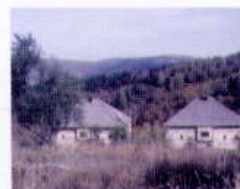
Kuli, vas Kičinica, okolica Reke, zahodna Makedonija. Two houses - towers, from village Kičinica, area of Reka, West Macedonia.