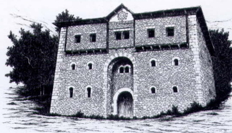
6. Kula, Krakornica, okolica Reke, 1988. House - tower, village Krakornica, area of Reka, 1988.