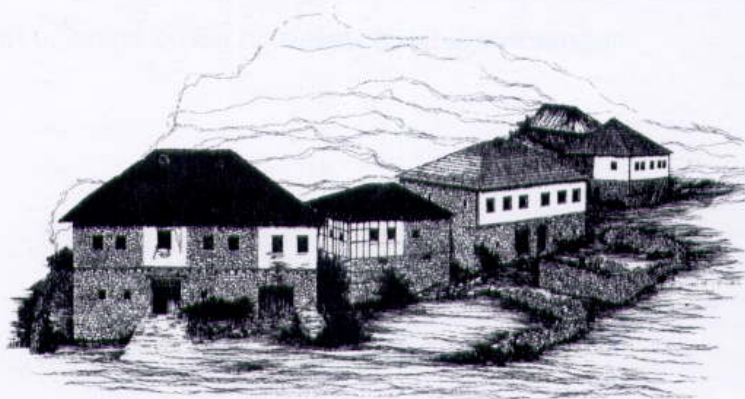
8. Skupina hiš, Brodec, okolica Reke, 1988. Group of houses, vil- lage Brodec, area of Reka, 1988.