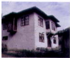
Hiša zaprtega tipa, vas Ratevo, okolica Maleševije, vzhodna Makedonija. House of closed type, from village Ratevo, area of Maleševija, East Macedonia.