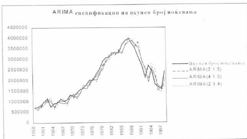
Графикон бр. 3

Како што споменавме, сите алтернативни модели подеднакво добро ја отсликуваат оригиналната временска серија т.е претставуваат задоволителна спецификација на вистинскиот модел што илустративно е прикажано на графиконот бр. Во продолжение, t-статистиката на поединечните параметри е задоволителна бидејќи повеќето од нив се високо сигнификантни, а исто така, Лјунг-Боџ тестот покажува дека резидуалите се стационарни т.е избраните модели се задоволително добри.