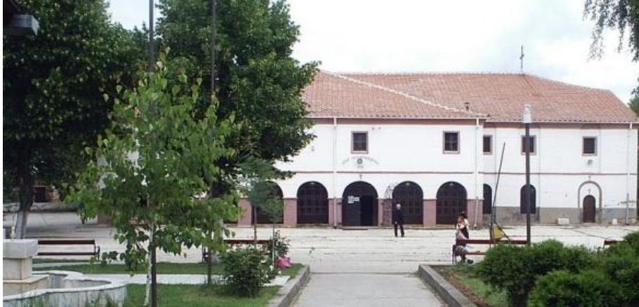
Фиг. 1. Панорамна снимка от двора на Св. Благовещение

Начало на 19 ти век, период с голямо значение за Македонския народ, явява се възраждане във всички пори на општественият и политическия живот на македонците.