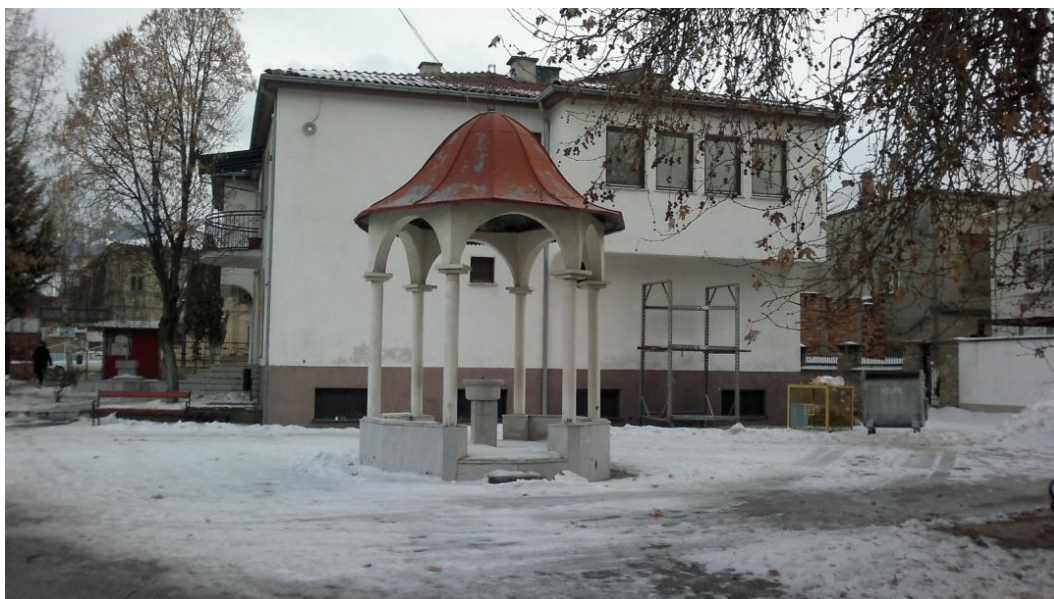
Фиг. 5. Изглед на чешмата