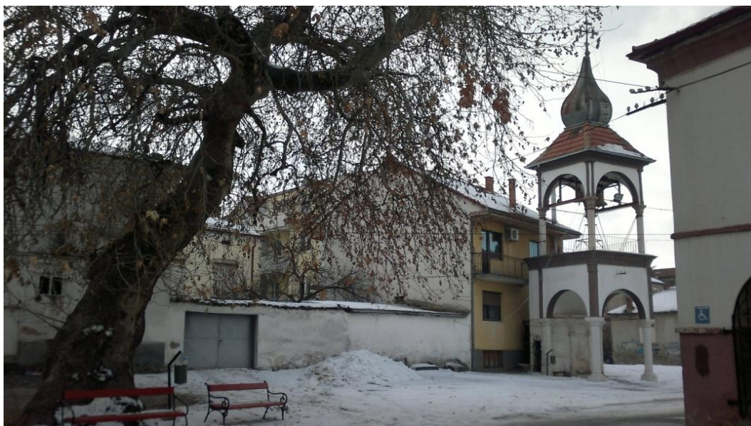
Фиг. 4. Изглед от двора на черквата към камбанарията

Кон западната страна на църквата в църковният двор е повдигната камбанария в барок стил кой се състои от една камбана. На южната страна се намира гостоприемница, а на юго-източната страна се намира гробното пространство което е със сравнително добре подържана градина.