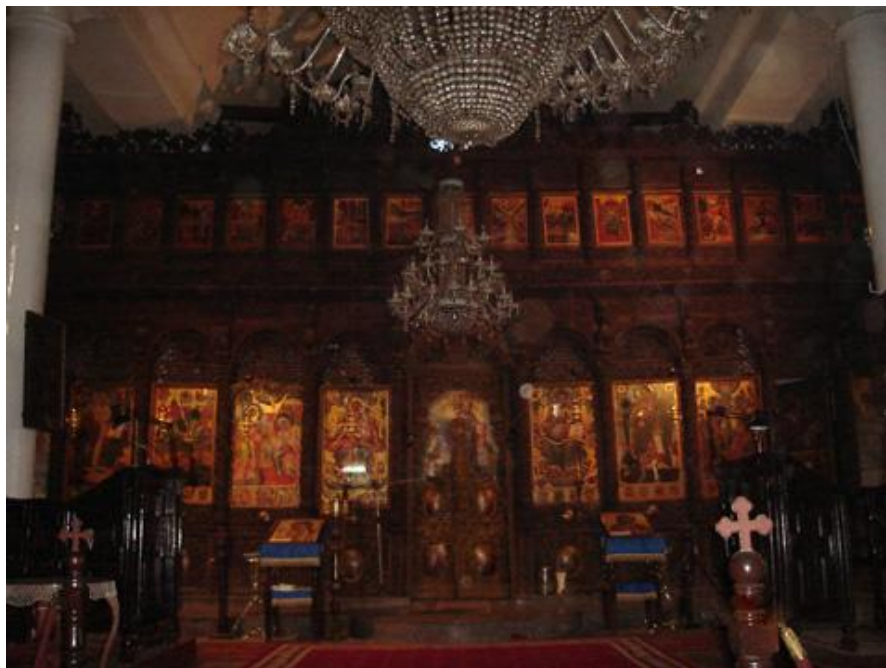
Фиг. 7. Вътрешен изглед на църквата с поглед към иконостаса

За разлика от външния вид вътрешната украса е далеч понагласена. Стенописите в самата черква са представени с много малък процент в сравнение с дърворезбата (фиг.7). Църквата е известна с нейния иконостас заради уникалната дърворезба.