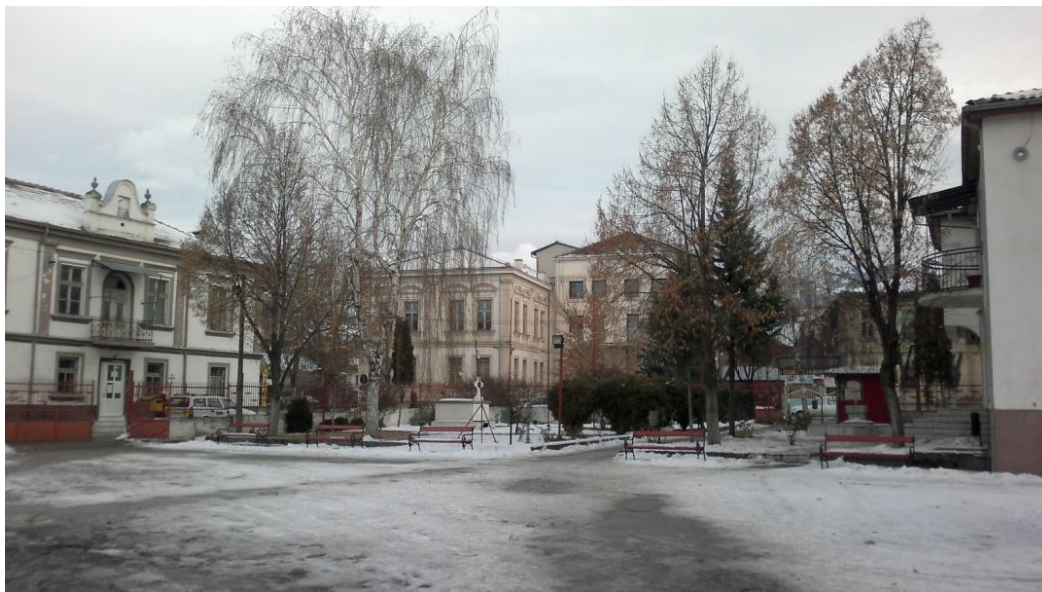
Фиг. 6. Изглед от двора на църквата към гробното пространство и на обекта за прием на посетители

Самия двор (фиг. 6) е организиран доста пестливо в поглед към растителността. В самия двор, западно от чешмата се намира едновековен дъб. Озеленяване в двора на черквата има само от южната страна т.е. в дворното пространство пред гостоприемницата и около гробното пространство.