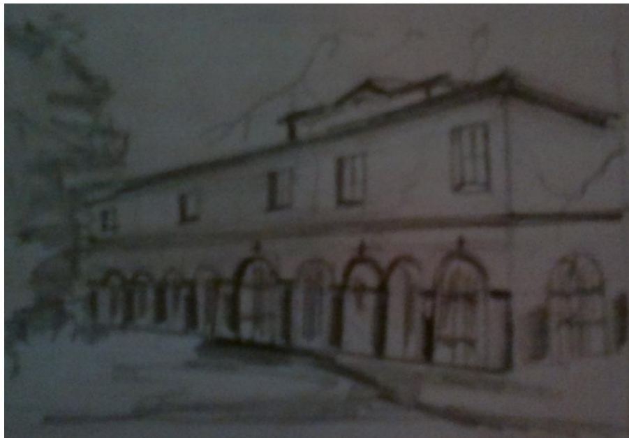
Фиг. 2. Рисунка на главния вход на Св. Благовещение

Църквата Св. Благовещение (фиг. 1) се намира в централната част на град Прилеп. Построена е в 1838 г. защото в този период града нямал църква, където и могъл да извършва неговите религиозни обреди. За изграждането на църквата в Прилеп, какъв е бил случаят и на други черкви в Македония, която се градили през 19 ти век били инициатори, уважавани личности на града.