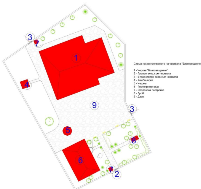
Фиг. 3. Схема на застрояването на черквата "Благовещение" – 1 – Църква "Благовещение", 2 – Главен вход към черквата, 3 – Второстепен вход към черквата, 4 – Камбанария, 5 – Чешма, 6 – Гостоприемница, 7 - Стопанска постройка, 8 – Гроб, 9 – Двор

Дворното пространство на Св.. Благовещение е оградена с желязна ограда, а самата църква се намира в северната страна на двора. От направените измервания бе установано, че двора на черквата е с площ 3975 м 2 .