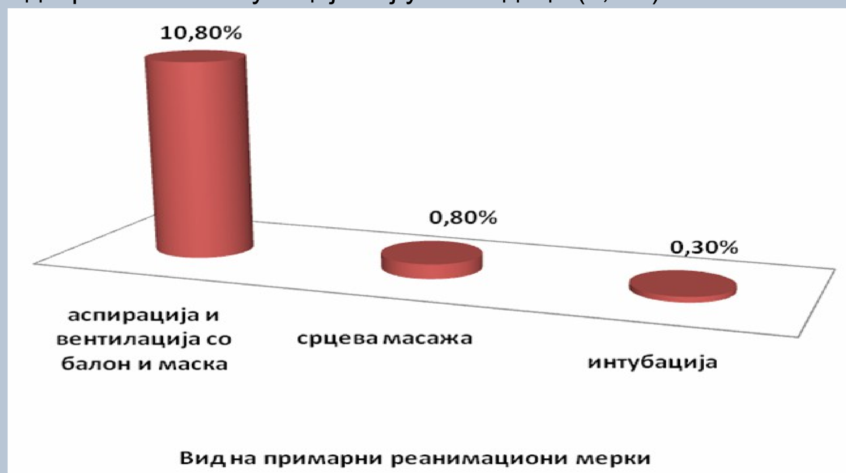
Слика број 2: Процент на применети примарни реанимациони мерки

Лесни реанимациони мерки се спроведени кај 154 (10,8%), срцева масажа е вклучена кај уште 11 (0,8%), додека пак ендотрахеална интубација-кај уште 5 деца (0,3%).