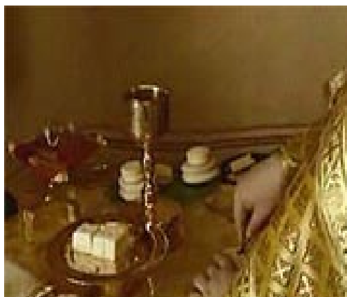
Слика 2. Света Тајна Причест

Подвигот на вера и молитвата се неразделно поврзани со светотаинскиот живот . Оној којшто верува и Му се моли на Триедниот Бог, учествува и во светите Тајни на Црквата. А света Тајна (мистирион) е литургиска служба, во која Светиот Дух остварува одредена промена или преобразување, што се однесува на целата Црква. 64 Затоа е од спасително значење за светот ваквиот светотаински живот. Центарот на тој живот е Светата Евхаристија која претставува причестување, заедничарење со Самиот Христос. Таа е сеопфатна Тајна на спасението.