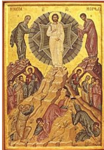
Слика 3. Преображение на Господ Исус Христос

почувствува Бога во себе, кога неговото срце ќе биде опфатено од дејството на Светиот Дух, тогаш тој има чудесна сила и планини да преместува само со еден кажан збор. Во тоа е моќта на православието, да преобразува.