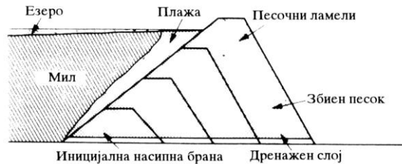
Слика 2. Низводна брана

Во најголем број на случаи надвишувањето се врши со помош на циклонирање или создавање на песок за браната.