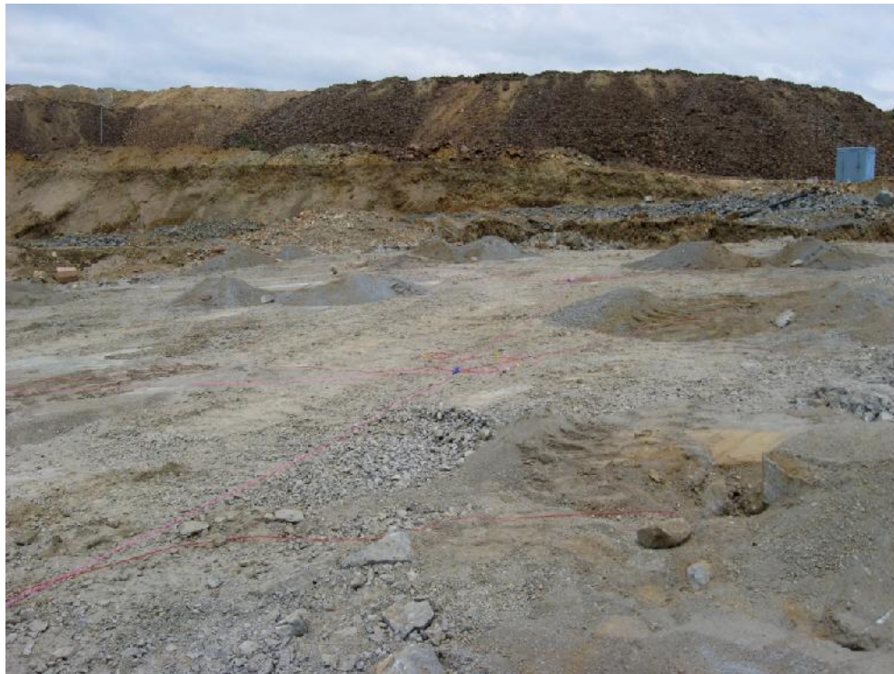
ПРИЛОГ БР. 3