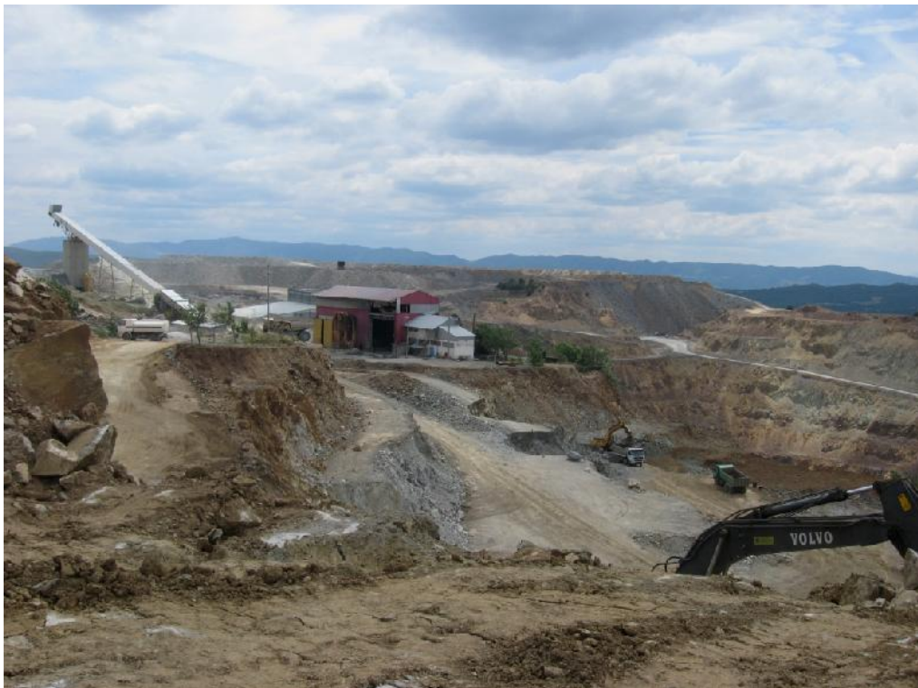
ПРИЛОГ БР. 4