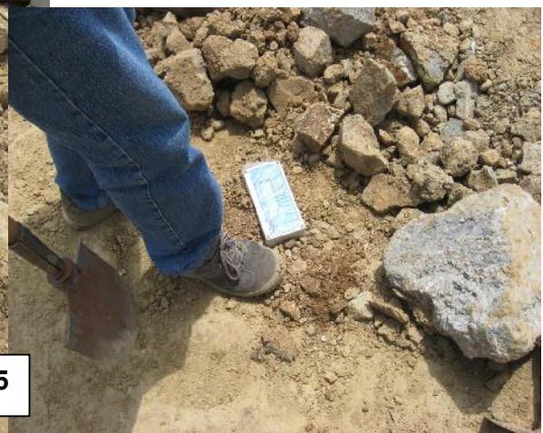
ПРИЛОГ БР. 5