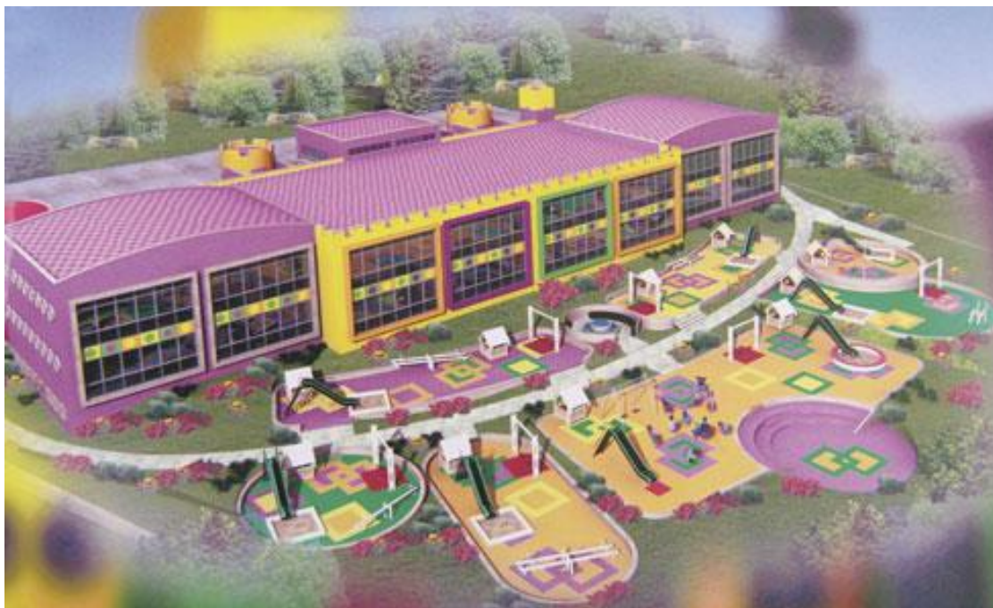
Сл. 4. Модерен тип на детски кът

Иновационния тип (сл.5) се състои от различни материали - пясък, вода, растителност и т.н. Това разнообразие от елементи предлага потенциал богато развитие на детската психа, творчеството, изследването и т.н. Тези площадки осигуряват на децата да формират свои собствени игрални обекти, както и да предоставят чудесна флексивност в това.