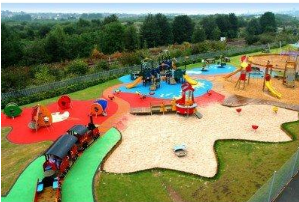
Сл.5. Иновационен тип на детски кът

Иновационния тип (сл.5) се състои от различни материали - пясък, вода, растителност и т.н. Това разнообразие от елементи предлага потенциал богато развитие на детската психа, творчеството, изследването и т.н. Тези площадки осигуряват на децата да формират свои собствени игрални обекти, както и да предоставят чудесна флексивност в това.