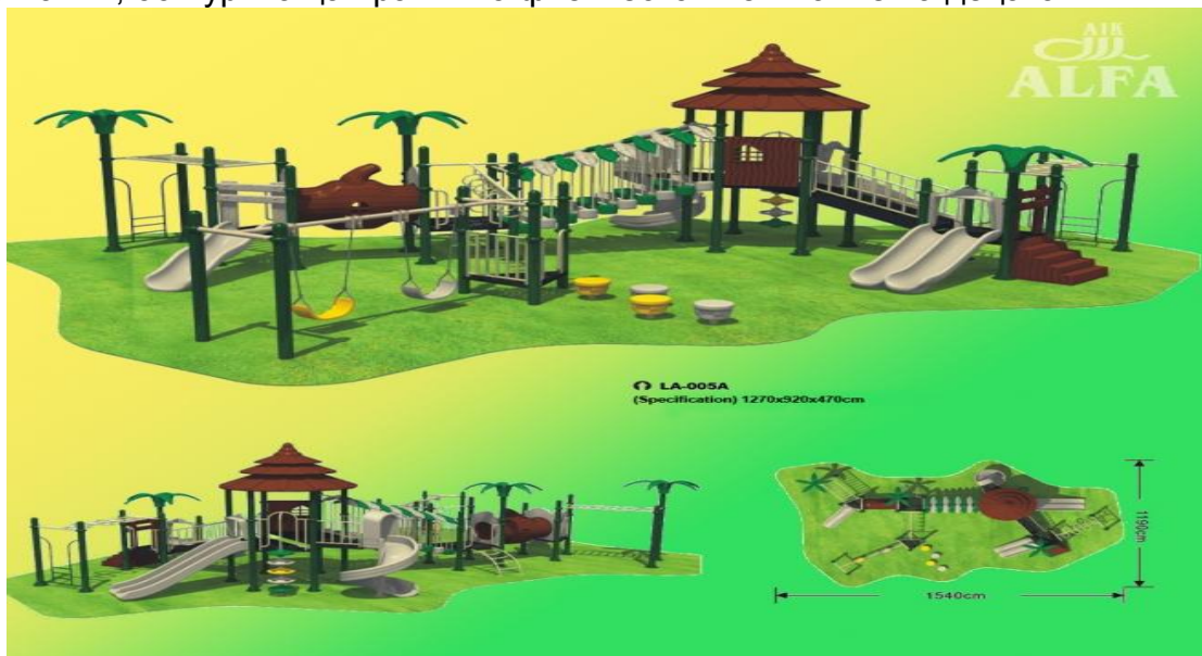
Сл. 1. Съвременен тип на детско съоръжение

3. Конструкцията на мебелите трябва да бъде в съвременен стил, проста, лека, красива, стабилна и здрава, съобразена със санитарно-хигиенните изисквания, осигуряваща правилно физическо възпитание на децата.