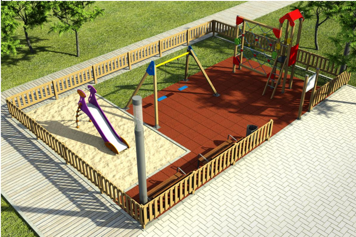
Сл. 3. Традиционен тип на детски кът

Традиционен вид на детски площадки(сл.3) е най-разпространената и се състои от люлки, пързалки и друго серийното оборудване. Те отговарят на нуждата от физическа активност, но не предлагат много възможности за познавателното и социално развитие. Тяхната роля до голяма степен е играта на открито, така да насочи вниманието на децата и дейностите на стандартно оборудване, което лишава децата от правото да извършва проучвания на природната среда.