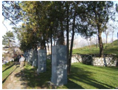
Сл. 8. Алејата на народните херои Fig. 8. Alley heroes