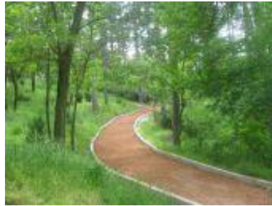
Сл. 3. Трим патека во парк „Могила” Fig. 3. Trim trail in the park Mogila