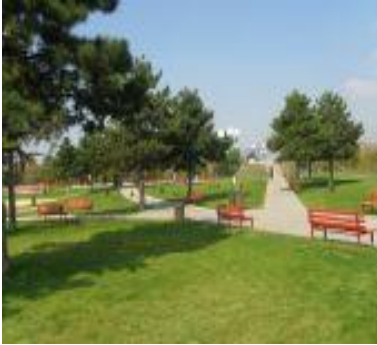
Сл. 5. Дел од зоната за пасивен одмор Fig. 5. Part of the area for passive recreation