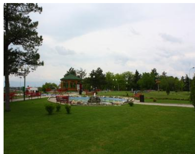
Сл. 4. Водна површина Fig. 4. Water surface