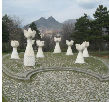
Сл. 7. Поглед кон четирите урни Fig. 7. Four urns