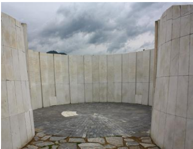
Сл. 6. Криптата- заедничката гробница Fig. 6. Crypt