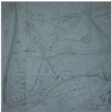
Сл.2. Парк „Могила” Fig. 2 . Park Mogila