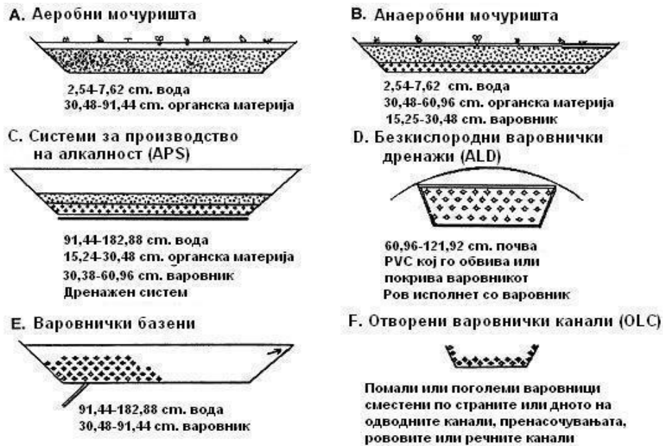
Сл. 2. Шематски дијаграми на системите за пасивен третман Fig. 2. Schematic diagrams of passive treatment system

Анаеробните мочуришта се во состојба да ги отстранат металите кои што се растворливи во киселина (посебно Fe и Al), како и да генерираат алкалност. Нивната ефикасност е ограничена од бавното мешање на водите од алкалниот супстрат со киселите води близу површината. За овие системи често пати е потребна голема површина и долго време на задржување. Како и кај другите системи за пасивен третман нивната ефикасност за отстранувањето на Mn е ограничена, освен во случај кога се користат големи површини.