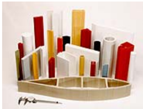
Слика 2. Примери за примена на пултрудирани профили (профили наменети за патната мрежа, столбови за маркирање во снег и друго.)[7]