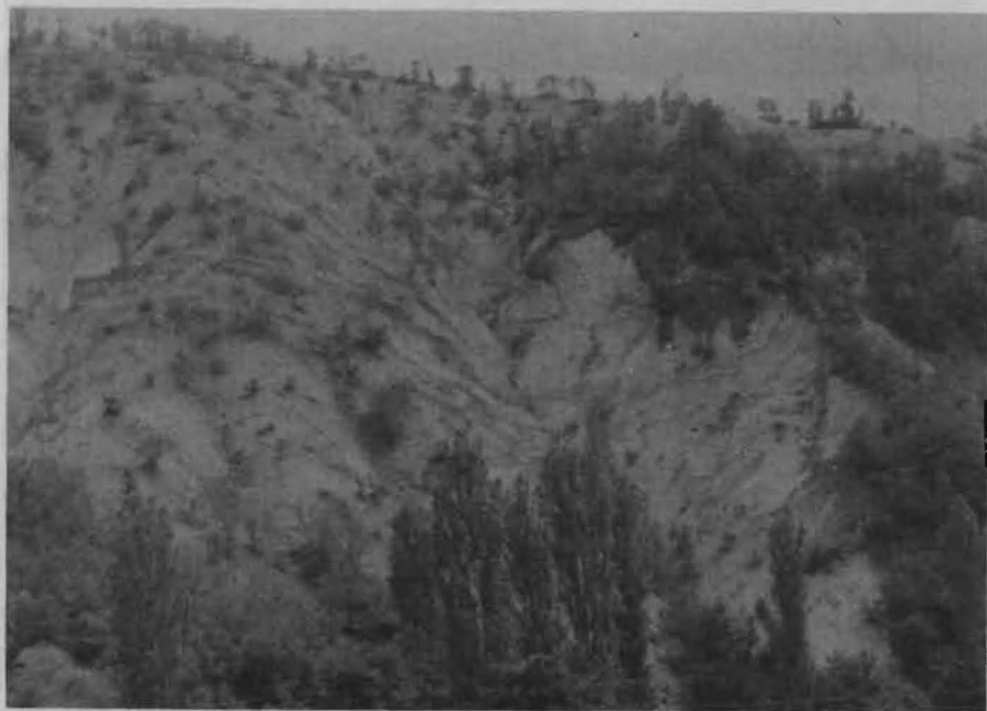
Сл. 4 Серија на туфови и лави од западниот обод на вулканската структура Шталковица – Спанчево

На североисточниот дел од испитуваниот терен јасно се гледаат два самостојни вулкански центри, продукт на постарите фази на вулканската активност. Тоа се вулкански центри на подрачјето на Дебели Дел (северно од Кратово) и кај денешниот врв Ул (североисточно од с. Близанци).