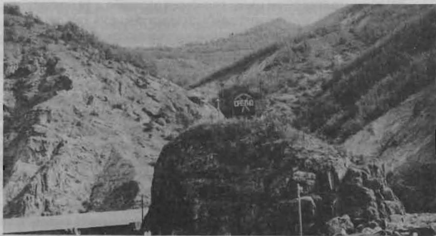
Сл. 2 Вулкански неск – Штура, Рудник „Злетово“ Fig. 2 Volcanic neck — Štura, Mine „Zletovo“

Лесновска вулканска калдера (сл. 1 – F). Југоисточно од Пластица, односно на подрачјето на Лесново и неговата поширока околина, маркантно се истакнува најдобро ерозино зачуваниот вулкански апарат на испитуваниот терен. Во рамките на оваа прстенеста структура доста добро е зачуван вулканскиот центар кој во современиот релјеф е претставен со некот кај месноста Илин Крст. Околу него морфолошки мошне јасно се истакнува лачниот прстен на Лесновската калдера (сл. 3). На авиоснимките јасно се гледаат лачните гребени, во основа изградени од сливови на лави со игнимбритски состав, кои можат да се следат во сите делови на вулканската структура, ориентирани од центарот, кон периферијата. Иако геоморфолошки мошне јасна и добро зачувана, Лесновската вулканска структура, според наше мислење, им припаѓа на постарите фази на вулканската активност, бидејќи нејзината геолошка градба ја сочинуваат игнимбритите од дацитски состав, кои се продукт на постарите фази на вулканизмот.