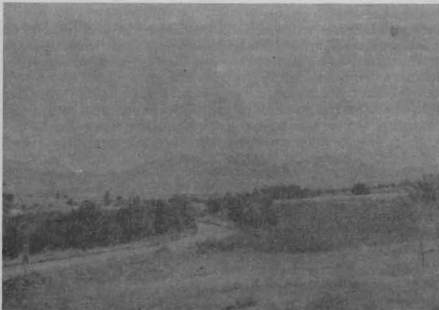
Сл. 3 Панорамска снимка на Лесновската вулканска структура (калдера) Fig. 3 Panoramic view of Lesново volcanic structure (caldera)

Вулканска структура Голак (сл. 1 – G). Следната крупна вулканска структура ориентирана во правец СИ-ЈЗ претставува вулканската структура на подрачјето на Голак, која се наоѓа североисточно од Злетово, односно западно од с. Шталковица. Оваа структура претставува индивидуализиран вулкански апарат, продукт на постарите фази на вулканската активност, со зачуван вулкански центар кај месноста Голак. Оваа вулканска структура има слични карактеристики како Лесновската. За разлика од неа, овде не се забележани карактеристични морфолошки форми, но јасно можат да се следат сливови и покрови на игнимбрити од дацитски состав, кои се лачно развиени во однос на главниот вулкански центар. И оваа изразито концентрично – лачна вулканска структура, според своите структурно – геолошки особености, претставува најверојатно продукт на постарите фази на вулканската активност.