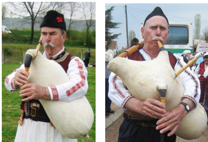
Сл.бр.3. Варијанти на гајди според врзувањето на мелодиските елементи

Кај составните делови на гајдата се среќаваат и одредени украсувања (орнаменти) кои се израз на индивидуалната уметничка креативност на изработувачите на гајди а воедно ја збогатуваат и естетската вредност на