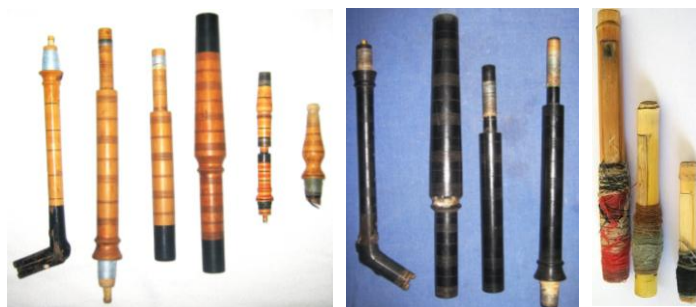
Сл.бр.2. Мелодиски елементи кај гајдата: гајдарка, брчало (пискарник, среднак и брачало), слагарче и дувало (изработени дрво и рогови) и писки

Брчалото е составено од три дела од кои првиот дел во кој што влегува писката се нарекува пискарник, вториот среднак а третиот брчало по кој е и наречена бордунската цевка. Деловите на брчалото се изработени така што се навлекуваат еден во друг и овозможуваат скратување и продолжување на брчалото со вовлекување и извлекување со што се постигнува потребната висина кај бурдонот. Слагарчето е составено од два дела кои исто така се навлекуваат еден во друг овозможувајќи постигнување на потребната висина. На мевот (кожата) се врзуваат „главини“ во кои се вметнуваат гајдарката, брчалото, дувалото и слагарчето. Главините се изработуваат претежно од рогови на бивол а во недостаток на рогови често користат материјали од пластика кои ги оформуваат според намената и се замена за роговите. Освен главините, од рогови може да се изработуваат и останатите мелодиски елементи но овие гајди се поретки. 5 Тонот кај гајдата се добива со помош на еднојазични писки изработени од трска со должина прилагодена според нивната намена односно дали е за гајдарка, за брчало или за слагарче (Сл.бр.2).