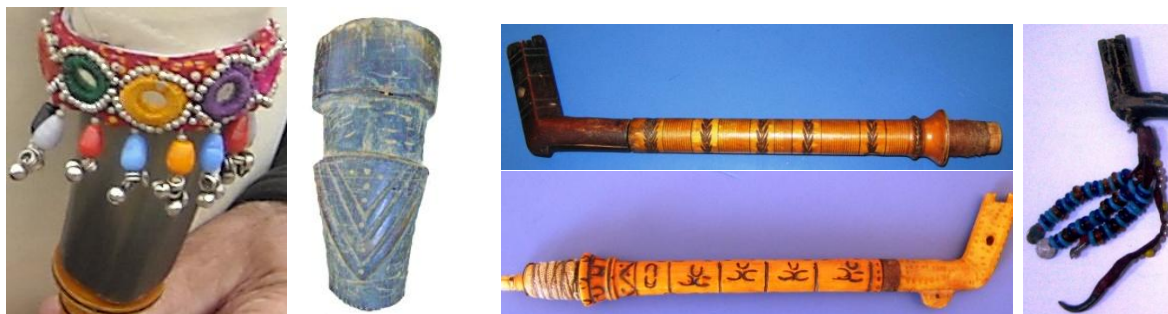
Сл.бр.4. Украсни орнаменти кај гајда (главини и гајдарка) и монистри со нокот од орел

инструментот. Се украсуваат сите составни делови делови со орнаменти кои се постигнуваат со резбање и во поново време, со користење на црна боја. На цилиндричните елементи (гајдарка гајдарка, брчало, слагарче и дувало) им се врежуваат концентрични кругови кои се изработуваат со вртење со голема брзина на прилагодена алатка дребанг (герм.: Drehbank – струг), со допирање на метална жица при што се создаваат правилни кругови. 7 Покрај ова украсување, гајдациите своите гајдарки ги украсуваат и со монистри и стари монети. На врвот од монистрите, најчесто се става нокот од орел или сокол со чија помош се вади восокот кој што се наоѓа над мелодиските отвори. Восокот служи за стеснување на отворите за попрецизно штимање на тоновите кај гајдарката (Сл.бр.4). 8