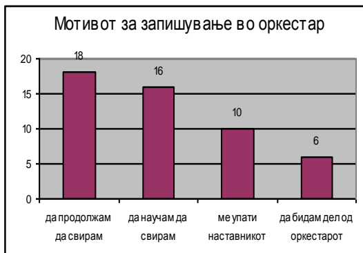
графикон бр. 1

Резултати: Според етничката припадност, 80% од членовите се Македонци а останатите 20% се припадници на други националности: Бошњаци, Турци, Роми и Албанци. Од испитаниците 70 % изучувањето на инструментот го започнале во основното училиште, 24% во специјализирано музичко училиште и 6% се самоуки. За да го дознаеме мотивот за членувањето во оркестрите им понудивме повеќе можности за одговор што може да се види од графичкиот приказ бр.1: