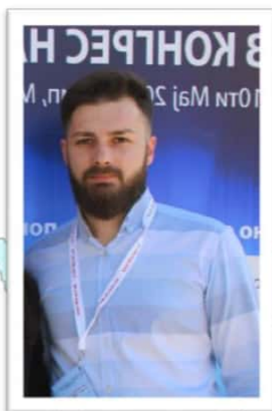
Претседател: Коста Замановски