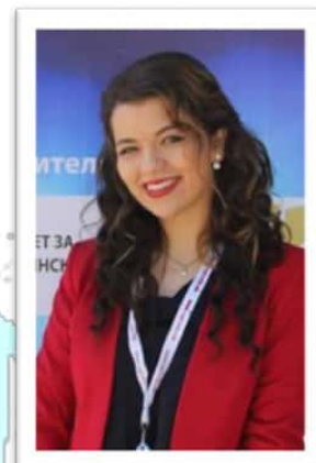
Потпретседател: Васка Џорлева