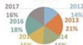
ДИАГНОСТИЦИРАНИ ПАЦИЕНТИ СО КОЛОРЕКТАЛЕН КАРЦИНОМ ВО БИТОЛА