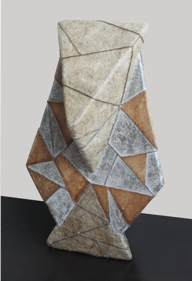
„Структурни модификации“ (55x35x32cm.)