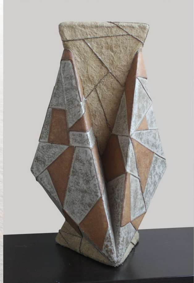
“Structural modifications” (55x35x32cm.)