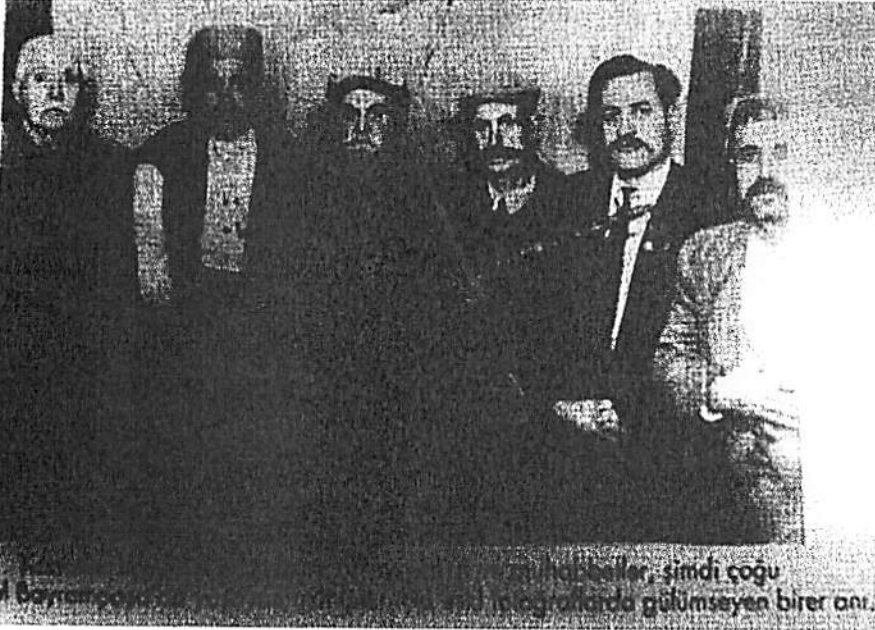
Istanbul Bayramı... Hacı Bektaş, şimdi çoğu... İstanbul'da gülümseyen birer anı.