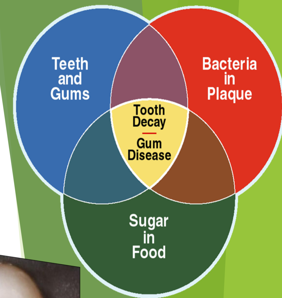
Factors That Cause Tooth Decay and Gum Disease

Ако болката по ендодонтскиот третман е интензивна, ова би можело да биде знак на компликации во текот на третманот а во мал процент од случаите може да е потребно и екстракција на забот за да се ослободи болката во коренскиот канал. Најчесто пациентите се прашуваат како е можно да појави болка на забот откако ќе се отстрани пулпата (нервот), но треба да знаат дека обично се пародонталните ткива кои предизвикуват болка во каналот а не третираниот заб.