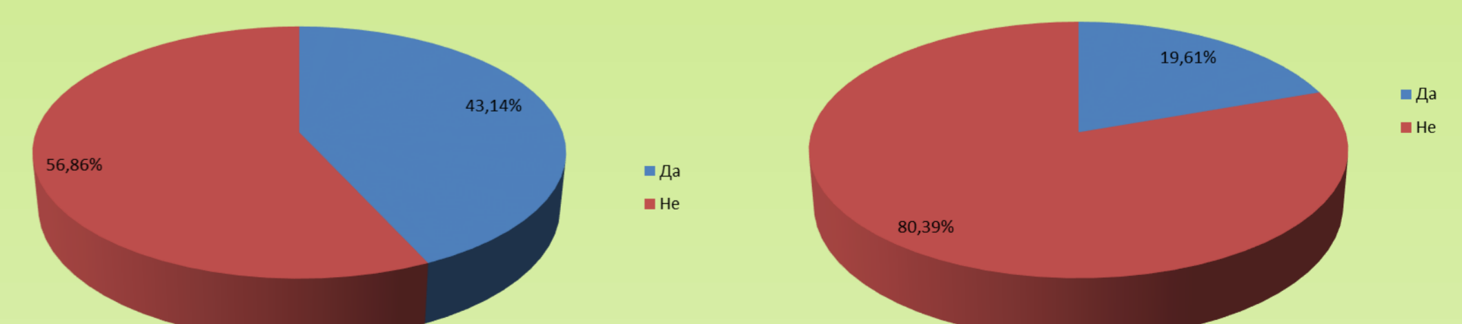
Сл.3 Употреба на преостанати антибиотици и без лекарски рецепт

Дали купувате антибиотик без лекарски рецепт?