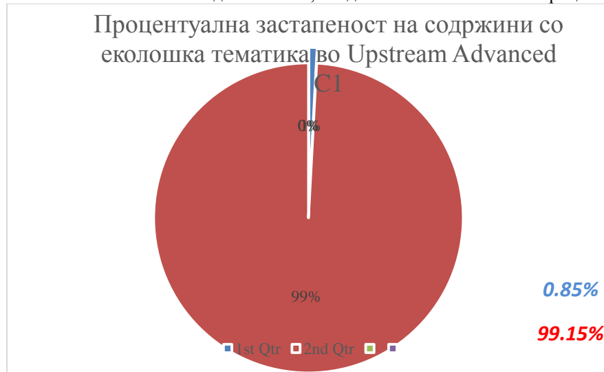
Слика 4. UpstreamAdvancedC1

Барајќи содржини со еколошка тематика од оваа книга, најдовме на навистина мал процент.