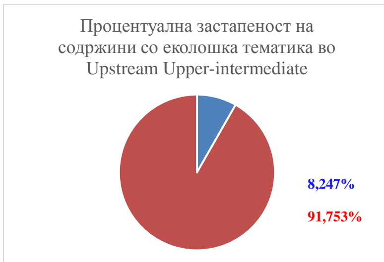
Слика 3.Upstream Upper-intermediate

Во оваа тема е понуден нов вокабулар поврзан со екологијата.