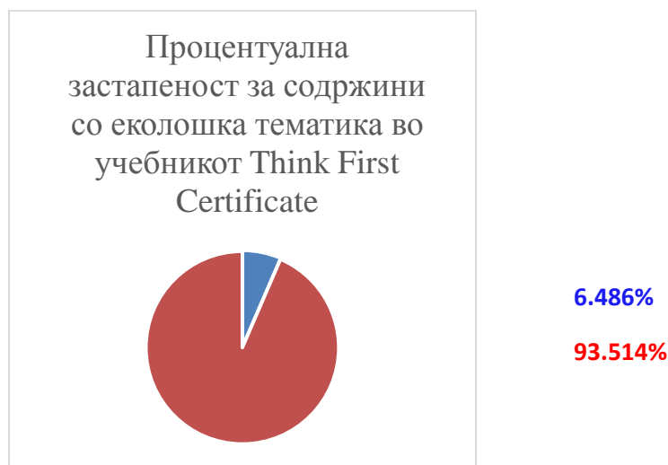
Слика 2. Think First Certificate

Понатаму е текстот со наслов Проклетството на автомобилот. Овде е прикажана суровата вистина на 21-от век. Во големите градови животот на луѓето станува помизерен поради пренаселеност и гужва, бучава и загадување од моторните возила. Загрижувачки се податоците за појава на астма и респираторни проблеми. За да се дојде до некакво решение секој човек треба да појде од себе.