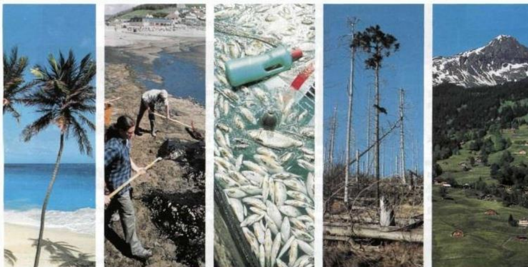
Слика 1. Примери за еколошка катастрофа

Природниот свет е под насилан напад од човекот. Морињата и реките се затруени со токсични отпади, хемиски емисии и загадување со опасни токсини. Воздухот што го дишаме е загаден со чад од фабриките и моторните возила, дури и дождот е затруен. Владите и индустриите низ светот ги засилуваат напорите за исцрпување на природните минерални богатства. Прашумите и замрзнатите континенти се исто така под сериозна закана. Но, сепак има надеж. Организацијата Гринпис (Greenpeace, https://www.greenpeace.org/international/ ) презема мерки кога ѝ да е загрозна животната средина. Нејзините научни презентации и мировни директни активности на копно и на море ги шокираа индустриите и владите и им дадоа до знаење дека Гринпис нема да дозволи природниот свет да биде уништен. Активностите на Гринпис најдоа на поддршка и восхит од милиони луѓе.