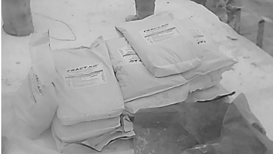
Слика 5. Експандирачка смеса во прашкаста форма FRACT.AG.

Експандирачката смеса е во паковање во вреќи од 5 kg и од 20 kg во прашкаста форма. Материјалот се става и меша со рачен миксер во метален сад со 6 l вода. Мешањето на смесата трае 4-5 min за подобро измешување, за да по тоа се става во веќе направените дупкотини, кои не смеат да бидат продупчени, како не би дошло до истекување на смесата, (Слика 6).