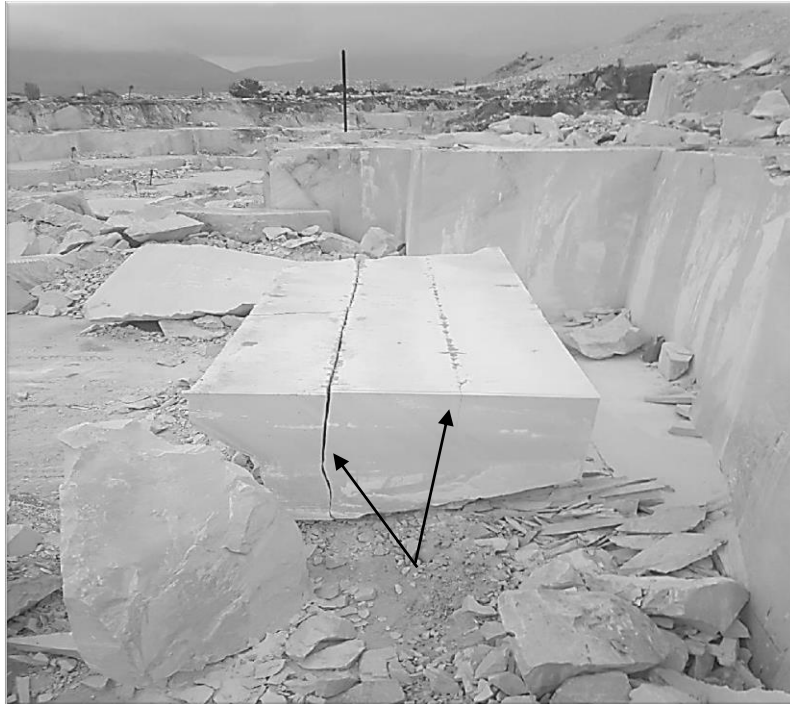
Слика 4. Цепење на продуктивна ламела со експандирачка смеса

Намалувањето на трошоците и времето за дупчење во основа се намалуваат за три пати, што не е занемарлив фактор. Направено е пробно полнење на дупчотините со експандирачка смеса во издупчени редови на продуктивна ламела со растојание помеѓу дупчотините од 10(см), но е ставано од експандирачката смеса на секоја втора и секоја трета дупчотина. Времетраењето на дејствување на смесата е побрзо во случај кога се полни секоја втора дупчотина, но секако е и поскапо.