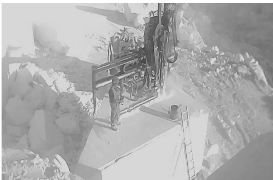
Слика 1. Дупчење на продуктивна ламела со дупчалка ПЕРФОРА, ИТ

Откако ќе се собори продуктивна ламела на работниот планум се врши перење на истата за да се види компактноста на истата и да се направи кроење. Кроењето на продуктивната ламела се прави во правец на калцитните вени или спротивно на вените. По оваа работна операција се пристапува кон дупчење на ламелата во правец на бележаните линии, (Слика 1).