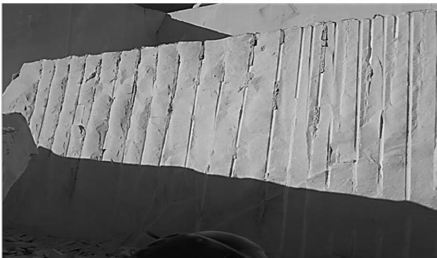
Слика 7. Изглед после цепење на продуктивна ламела со видливи пукнатини

Треба да се напомене дека ако се врши полнење на експандирачка смеса во дупчотини во дупчотини кои се пресекуваат со пукнатини кои се отворени треба да се користи полиетиленска обвивка во дупчотините, како не би дошло до истекување на смесата во пукнатините, со што би дошло до загуба на смесата. Ако има пукнатини во продуктивната мермерна ламела, со примена на класичните методи за цепење, рачно со метални клинови или со пневматски рачен чекан, често не доаѓа до целосно, правилно цепење на продуктивната ламела, заради дисконтинуитетот од пукнатините, односно доаѓа до цепење само до пукнатините, што не е случај и кога сеприменува експандирачка смеса. Во зимскиот период кога температурите се под нула, цепењето на продуктивните ламели и цепењето за оформување на комерцијалните блокови е отежнато со класичните методи на цепење рачно со железни клинови или пневматски рачни чекани, бидејќи заради ладното време доаѓа до неправилно цепење на мермерната маса, при што има потреба од дополнителна обработка на финалните комерцијални блокови. Заради оваа појава експандирачките смеси можат да најдат практична примена за цепење на мермерната маса. Времето на дејствување во нормални услови, ако нема температурни осцилации е 5-6 часа, доколку има температурни осцилации може да поминат и 20 часа додека се направи цепење по правецот на дупчење на редовите.