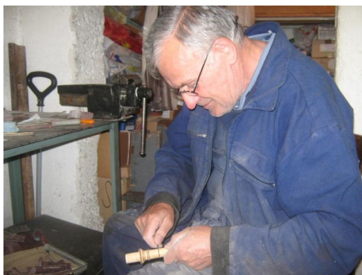
Украсување на гајдарка