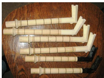
Делумно подготвени гајдарки