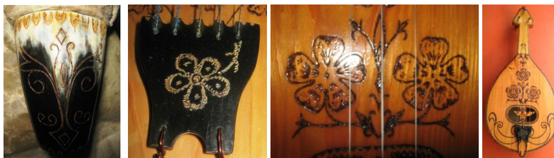
Орнаменти кај делови на инструменти