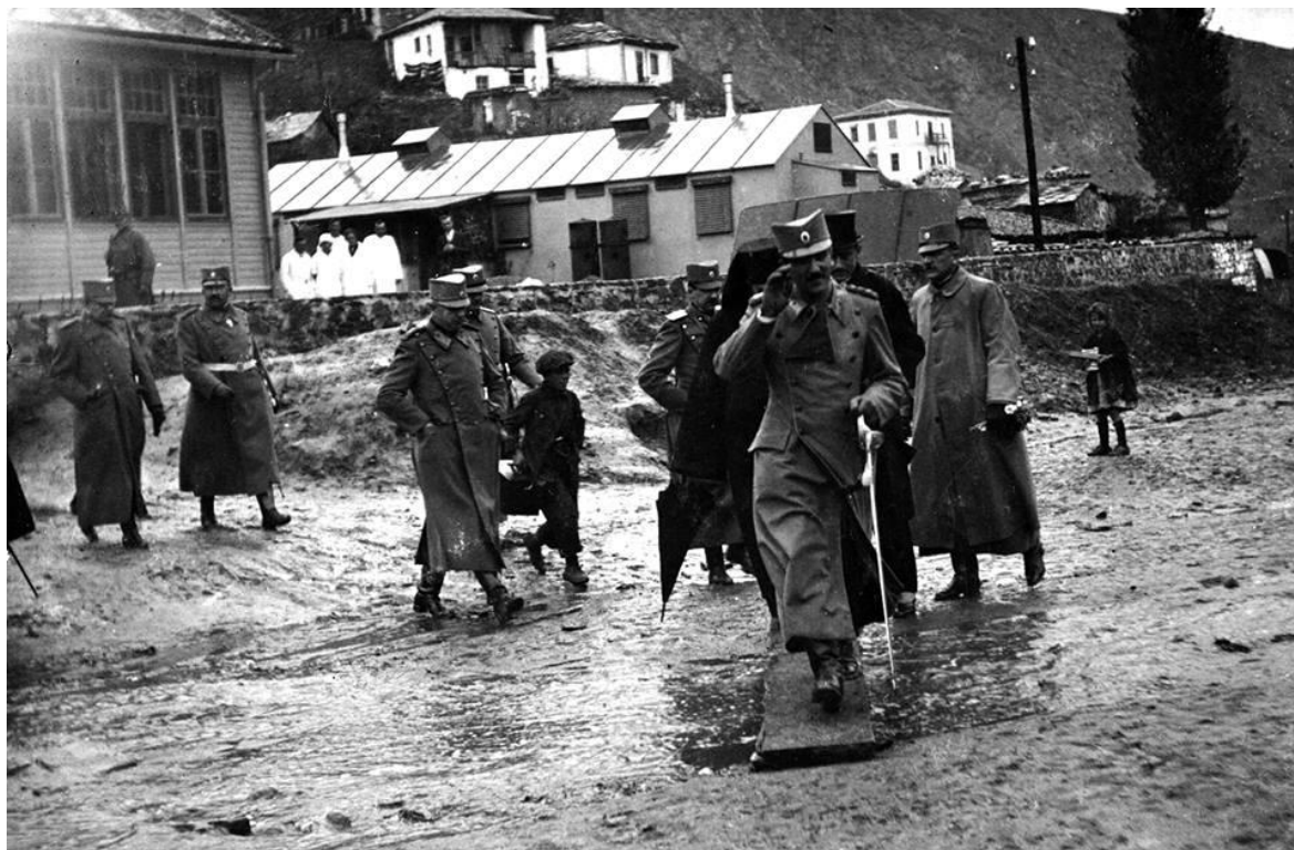
Кралот Александар во посета на Штип, 1924 год.