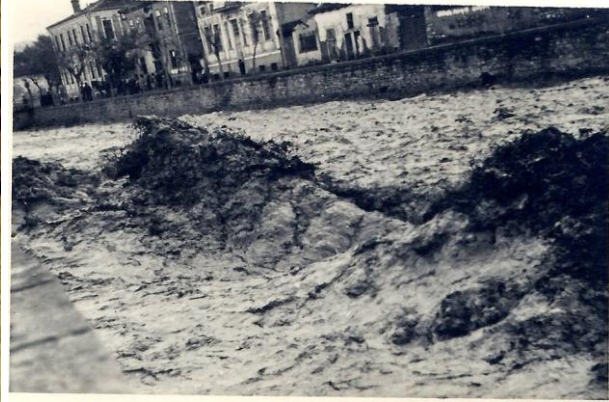
Реката Оџиња после поројни дождови (1934 год)

Уште многу забележани настани ќе се најдат на страниците на весникот Политика , судски процеси, активности на разни здруженија и граѓани, несекојдневни настани, кои ја отсликуваат сликата за животот во Штип и штипско кои можат да помогнат во реконструкцијата на политичкото, општествено-економското и културното живеење на овие простори во овој период.