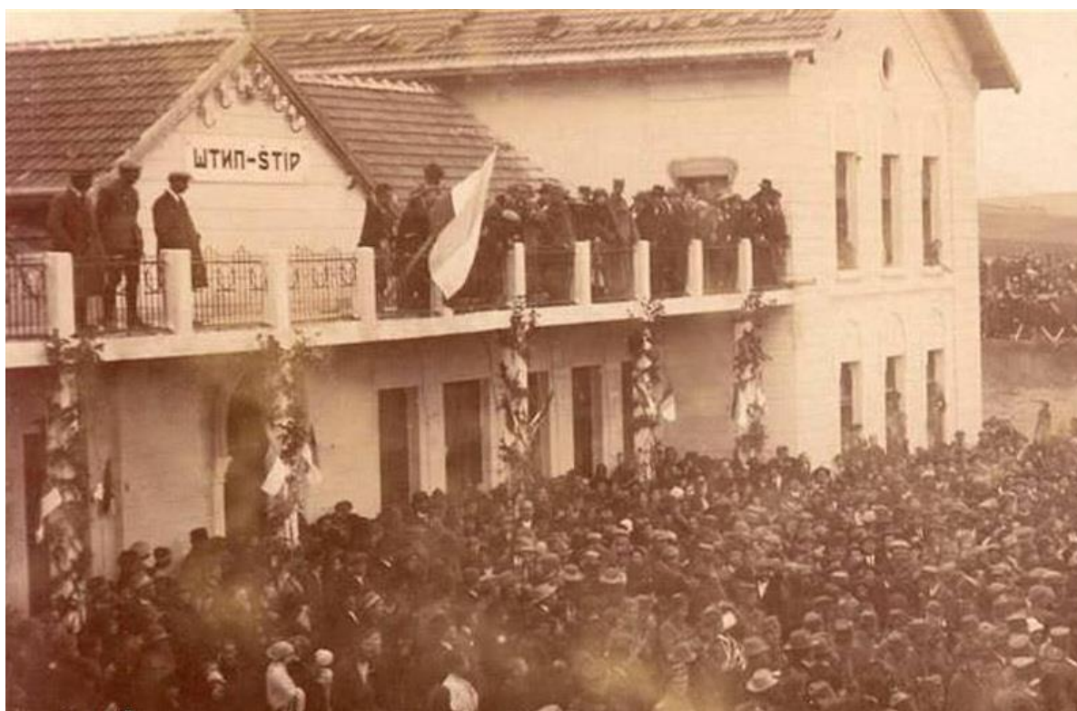
Железничката станица во Штип, во пресрет на пристигнувањето на возот во 1924 год.