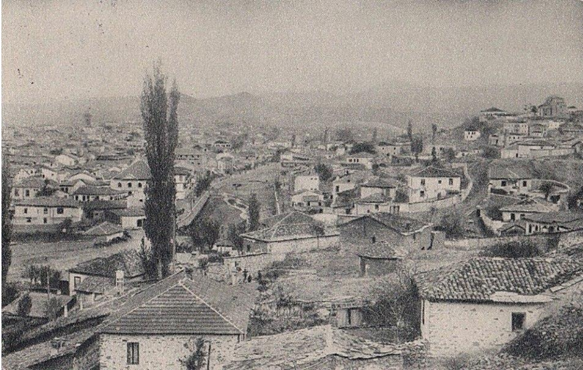
Штип, 1930 год, Кеј на банот Лазик (десната страна на река Отиња)

Забележани се и прославите во градот кои се организирале по повод ослободувањето на градот од бугарската власт и големата Брегалничка битка од 17.07.1913 год. Овие одбележувања биле во присуство на голем број лица од државната и локалната власт и богата програма. Одбележувањето на овој настан во 1933 год. ќе се најде и на насловната страна на Политика . 16 Во тој контекст се и следните прилози во весникот: