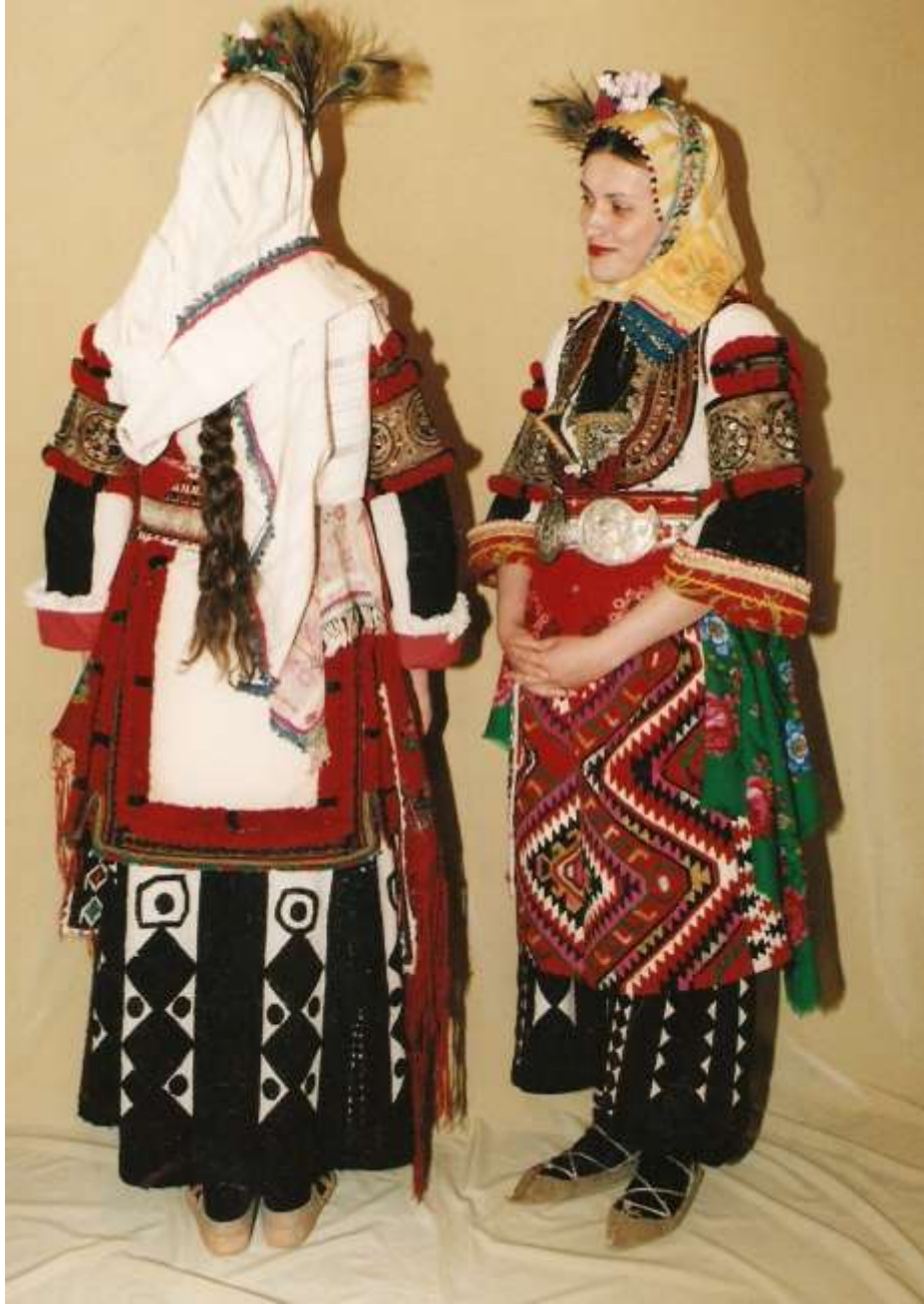
Водичарки село Булчани