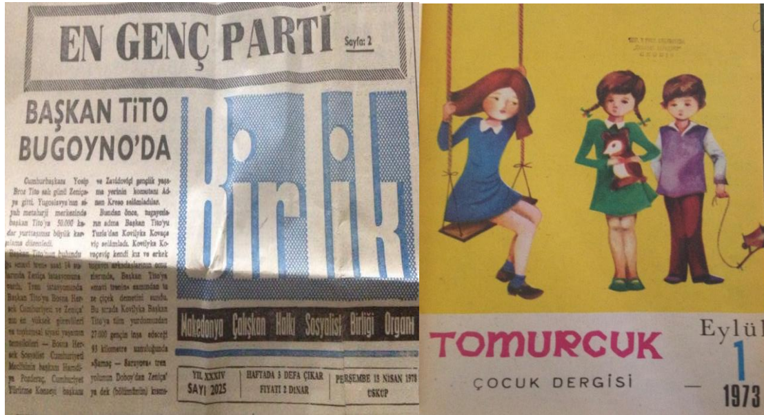
Makedonya'da ilk Türkçe gazete Birlik ve Çocuk dergilerinden Tomurcuk

1973 yılından Üsküp “Kiril ve Metodiy” Üniversitesi Felsefe Fakültesi ile Filoloji Fakültesi olarak ortak yüksek kurum olarak çalışmaktaydı, ancak daha sonra bu iki fakülte birbirinden ayrılarak kendi başına yüksek kurum olarak çalışmaya başlar. Makedonya Eğitim Bakanlığı'nın aldığı karara göre Yüksek Pedagoji Okulunu’da çalışan Dil ve Edebiyat bölümleri Filoloji Fakültesine geçmeleri karara bağlanır. Böylelikle tüm dil ve edebiyat bölümleri Filoloji Fakültesine geçmek zorunda kalır,