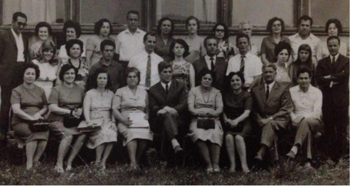
Üsküp "Tefeyüz" İlkokulunun yönetmenlik görevindeyken