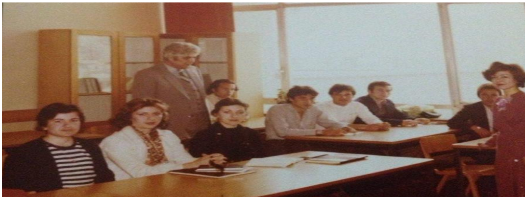
Üsküp-Türk Dili ve Edebiyatı Bölümünde bir ders saati

2001 yılından emekliye ayrılıncaya kadar kürsüde bu dersleri sürekli yapmıştır. Yapılan törende ailesi, dostları, öğrencileri ve sevenlerinin büyük ilgi ve katılımıyla gerçekleşti. 2001 yılının Mart ayında emekliye ayrılmasına rağmen kürsüde kadroya ihtiyaçtan dolayı hocamız daha üç yıl ders yapmaya devam eder.