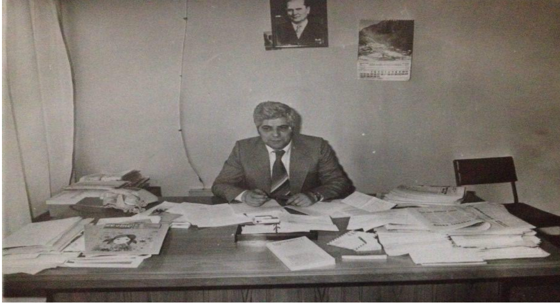
“Birlik” gazetesinin baş ve sorumlu yazarı

görevde bulundu. Bu dönem içerisinde gazetesinin muhtevası ve yeni sütunların açılmaları üzerinde çalışmış. Başta gelen Makedonya ve dolayısıyla Yugoslavya’da yaşamakta olan Türk halkının kültür, Eğitim, siyasi ve diğer sorunlarından mada Türk okuyucularını ilgilendiren bilgilere önem verilmektedir. Redaksiyonda gazeteden mada “Sevinç ve Tomurcuk” çocuk dergileri, kültür ve sanatta “ Sesler” dergisi ve Türkçe yayamevi olarak Türk yazarların eserleri devamlı olarak yayınlanmasına önem vermiştir.