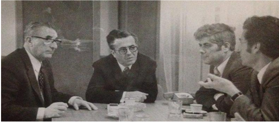
Komisyon üyeleriyle bir arada

Yüksek öğretim ve akademisyen ünvanına sahip öğretim kadrosu yokluğundan dolayı bölümde, birkaç dersi hocamız kapatmaya çalışır o dersler Türk Dilinin Metodik dersleri, Türk Dilinin Fonetigi, Türk Dilinin Morfoloji ve Sentaksı dersleriyle üstlenir. Bir ara Çocuk Edebiyatı dersleri de veriyor.