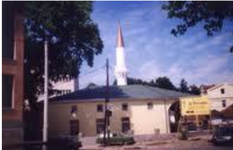
Сл. 2. Кадин Ана џамија

На територијата на грдаот Штип постоеле и други џамии , како: Шадрван џамија, која се наоѓала на местото каде денес се наоѓа градскиот плоштад и била срушена во тек на Втората светска војна, Султан Мурадовата џамија, Кајалар џамијата, Табаг-хан џамијата и Ашај теќе џамијата. Денес на местото на Ашај теќе џамијата егзистира само чешмата која била составен дел од таа џамија. Таа е сеуште во функција кај населението кое живее во тој дел од градот. Според пишаните податоци, меѓу двете светски војни во Штип имало седум џамии, од кои денес се останати само две- ХусаМедин Пашината џамија и Кадан Ана џамијата.