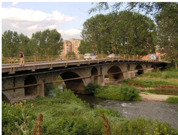
Сл.5. Кучук Емир султанов мост (денес)

„Повеќе чешми и шадрвани ги снабдувале со вода населбите во Македонија“, 18 па и во Штип. Овие чешми кои служеле за „снабдување на населението со питка вода, лоцирани обично во маалските центри, ги граделе специјализирани мајстори наречени чешмари, потоа шадрваните – најчесто градени во дворовите на џамиите поврзани со извршување на верскиот ритуал – абдест“. 19 Во Штип, во минатото постоеле повеќе чешми, распоредени во различни маала...иако мали по своите димензии, тие биле мошне сликовито вклопувани во просторот и биле присутни во секое маало – маалски чешми.