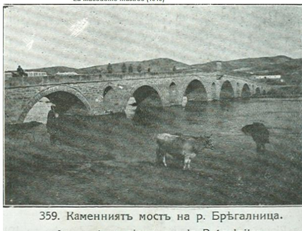
359. Камениот мост на р. Брџгалница. Le pont en pierre sur la Brégalnitza. Сл.5 Емир Кучук Султановиот мост во 1919 год.