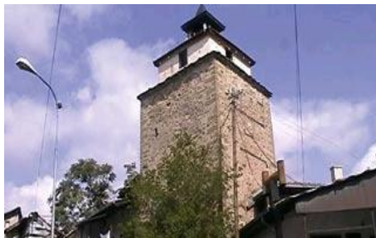
Сл.4. Саат кулата