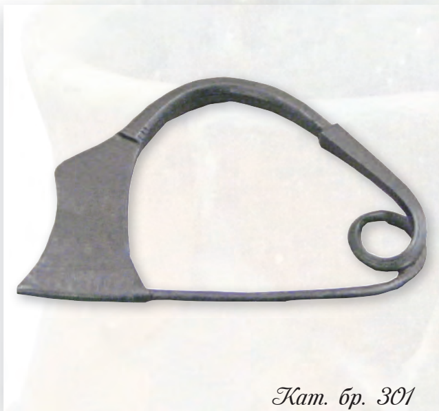
Кам. бр. 301