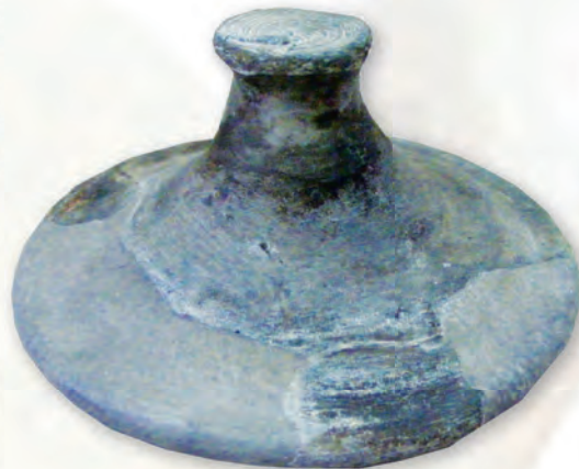
Кам. бр. 353