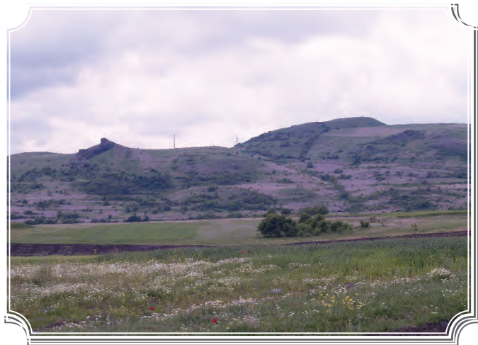
Сл.4 Панорамска снимка на населбата Градиште - Киево

Населбата Градиште село Горни Балван(Сл.4) припаѓа на т.н. градински тип на населби, поставени на доминантни и потешко пристапни места, притоа не ја исклучувам можноста иако не се откриени одбранбени сидови на населбата, истата сепак да била заштитена со фортификација.