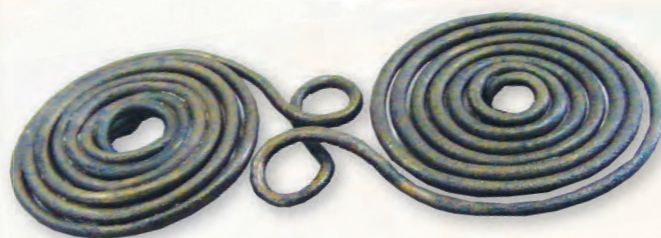
Кам. бр. 303