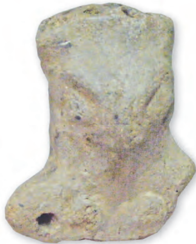
Кам. бр. 62