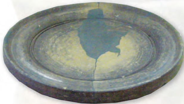
Кам. бр. 355