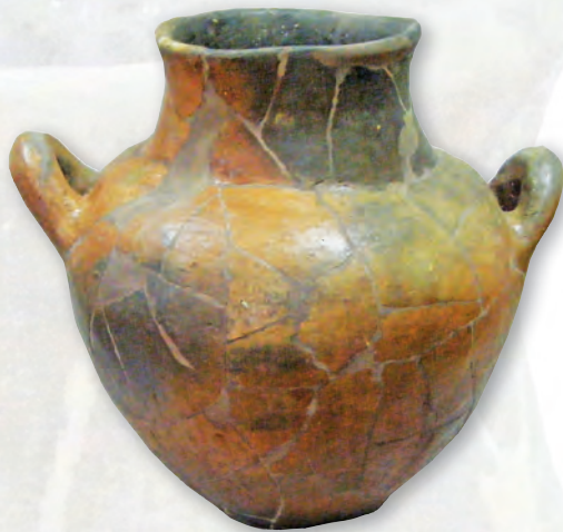
Кам. бр. 215