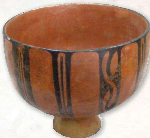
Кам. бр. 19