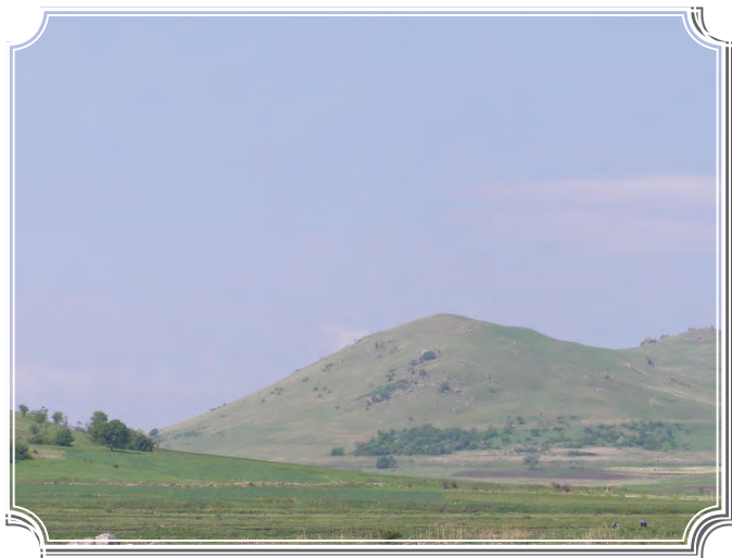
Сл.2 Панорамска снимка на енеолитската населба Богослов камен

Преминот од неолитот во бронзеното време го карактеризираат бурни промени сврзани со големите миграциони движења, поврзани со степско-индоевропските народи, кои барајќи подобро природни и климатски услови се населиле и на Балканскиот Полуостров. Со населу-