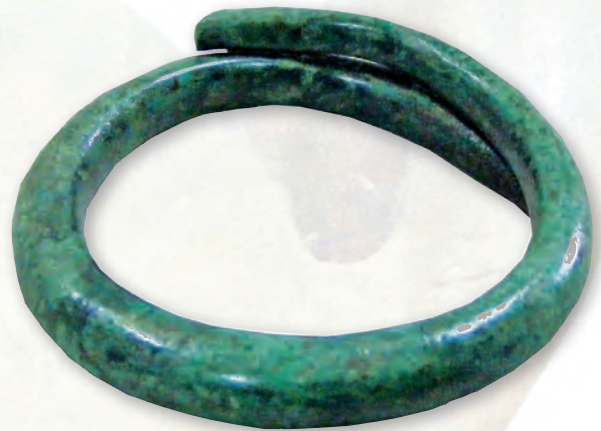
Кам. бр. 292