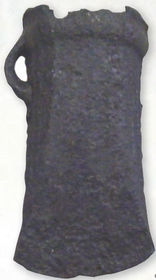
Кам. бр. 278