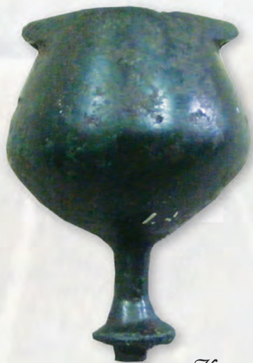
Кам. бр. 304