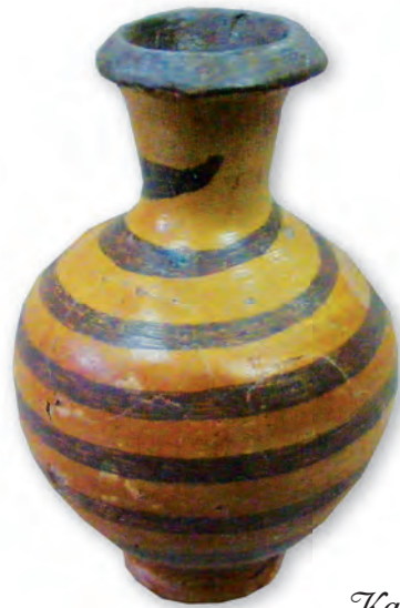
Кам. бр. 361