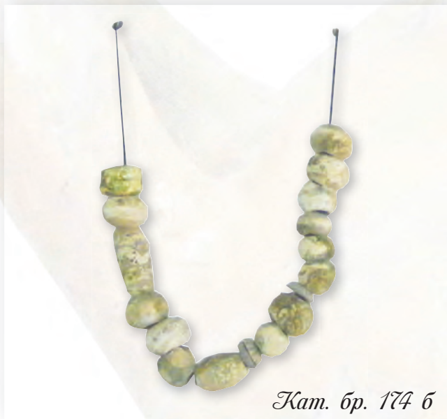
Кам. бр. 174 б