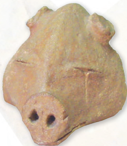
Кам. бр. 50