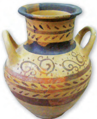
Кам. бр. 354