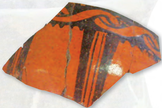
Кам. бр. 24