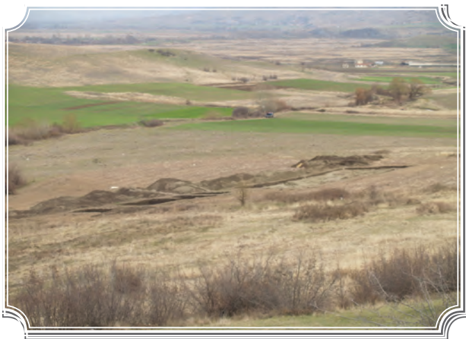
Сл.1 Панорамска на неолитската населба Грнчарица

Според карактеристиките на материјалната култура, Грнчарица би ја сместиле во рамките на монохромната фаза на раниот Неолит на Балканот, со најблиски паралели со Крајници I и Оходен во долината на Струма, Ашаги Пинар во турска Тракија, како и Дивостин и Доња Брањевица во Србија.