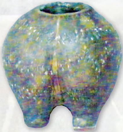
Кам. бр. 61