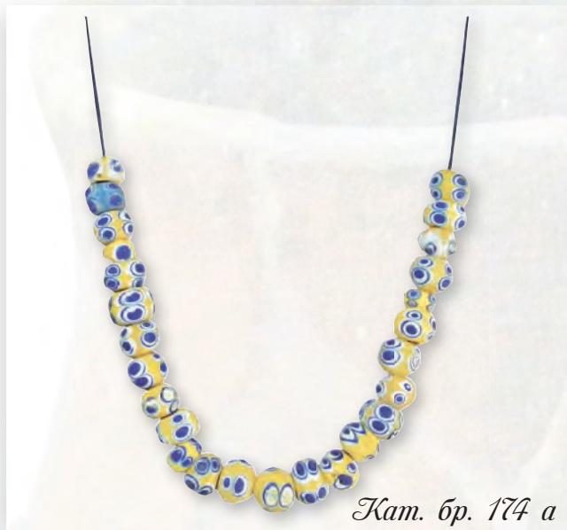
Кам. бр. 174 а