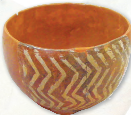
Кам. бр. 33