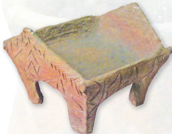
Кам. бр. 49