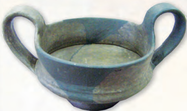
Кам. бр. 359