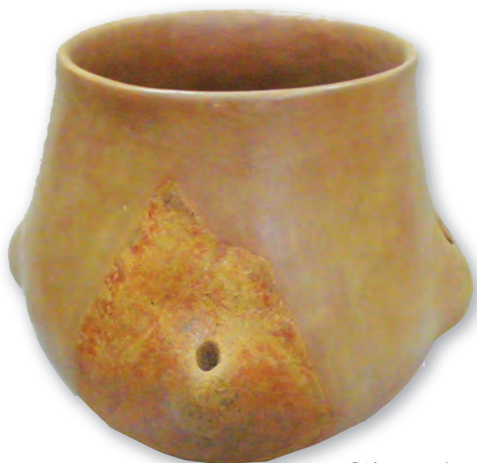
Кам. бр. 2