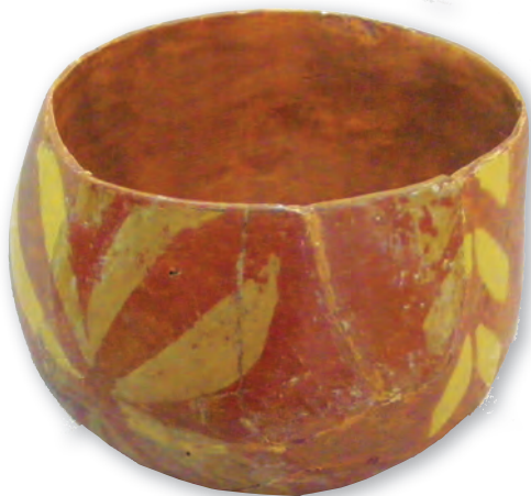
Кам. бр. 34