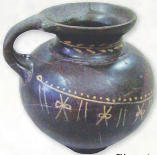
Кам. бр. 363