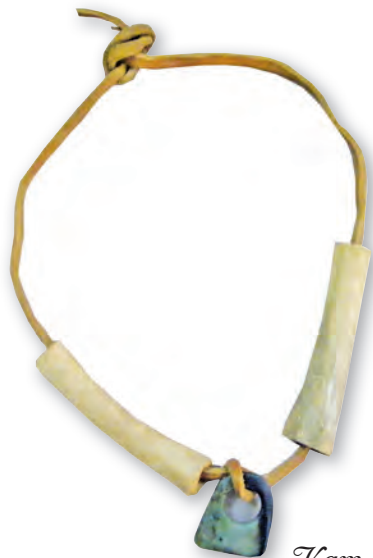
Кам. бр. 173