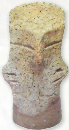
Кам. бр. 68