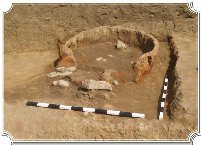
Сл.3 Печка – фурна Под Школо

рање и за приготвување за храна од кои во поставката е експонирана конзервираната печка – фурна (Сл. 3), кои ни даваат слика за економијата и секојдневниот живот на луѓето на самиот почеток на бронзеното време..