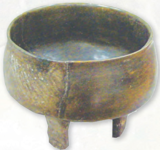
Кам. бр. 29