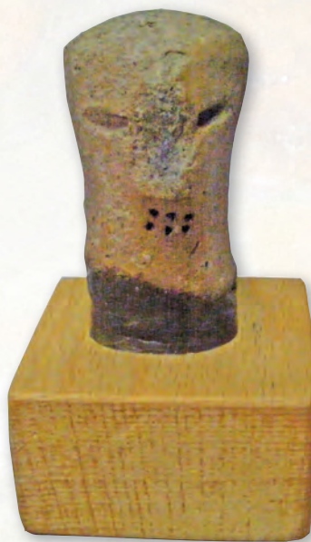
Кам. бр. 60