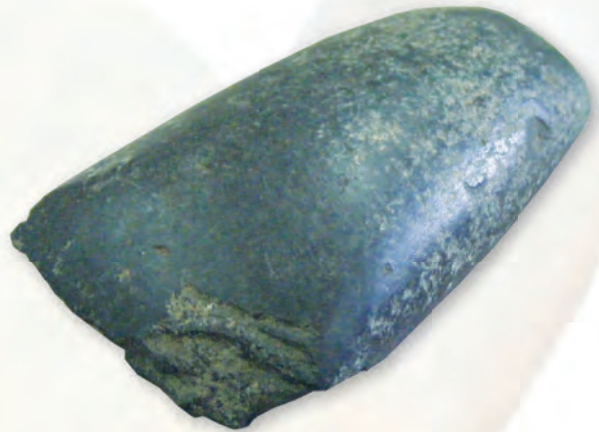
Кам. бр. 96