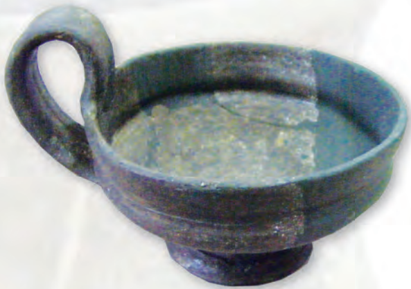
Кам. бр. 360