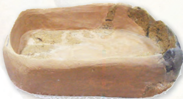
Кам. бр. 12