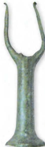
Кам. бр. 305