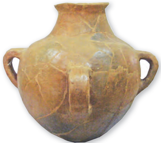
Кам. бр. 223