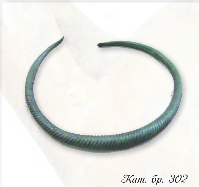
Кам. бр. 302