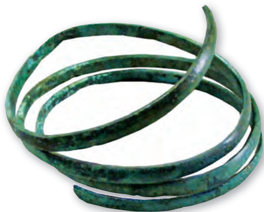
Кам. бр. 293