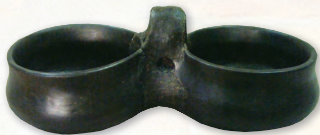
Кам. бр. 189