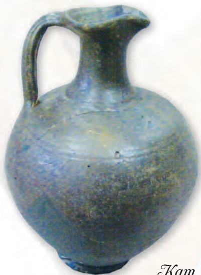
Кам. бр. 356