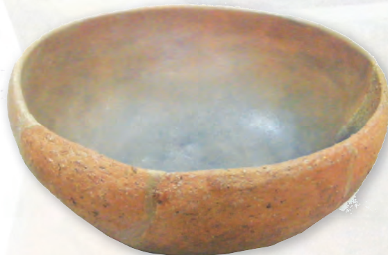
Кам. бр. 3