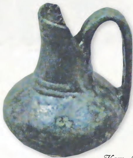
Кам. бр. 311