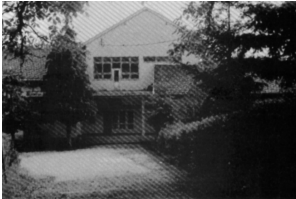
Влезот на училиштето „Трајан Белев“ - с. Цапари (1995 година)

со 2 подрачни осумгодишни училишта во селата Ѓавато и Рамна, како и 6 четириго-дишни подрачни паралелки во селата Ротино, Горно Српци, Лера, Свињишта, Маловишта и доленци. Во Лера и доленци постојат по една паралелка на македонски наставен јазик и по една паралелка на албански наставен јазик.