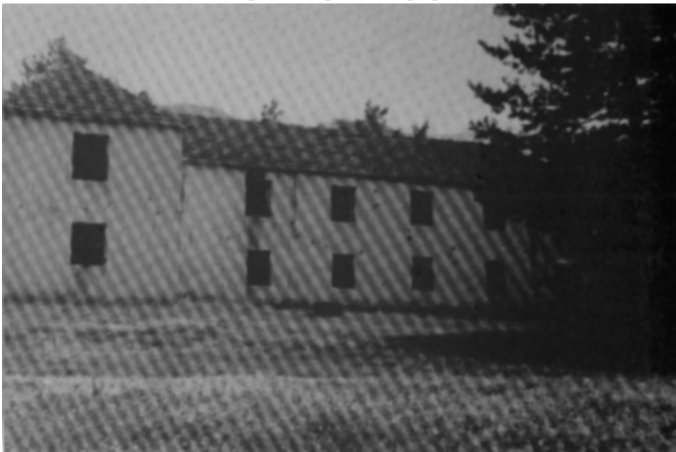
Училиштето во Рамна (1995 година)

Во учебната 1968/69 година централното основно училиште во Рамна располагало со: 95 клупи, 13 табли, 12 печки, 8 катедри, 4 сметалки, 8 шкафови, 5 фланелографи, 280 апликации, 17 гео-