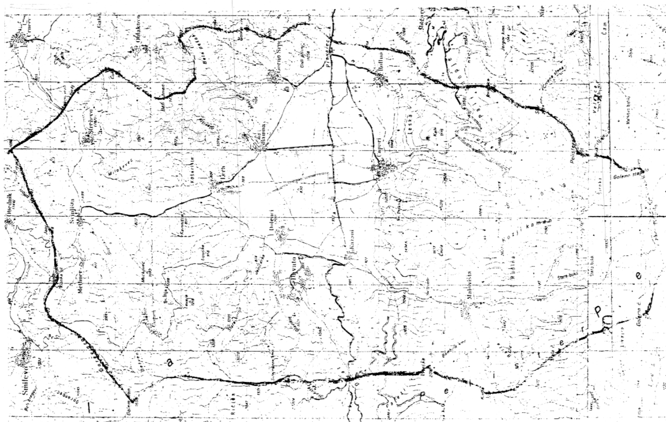
Топографска карта на Цапарско поле