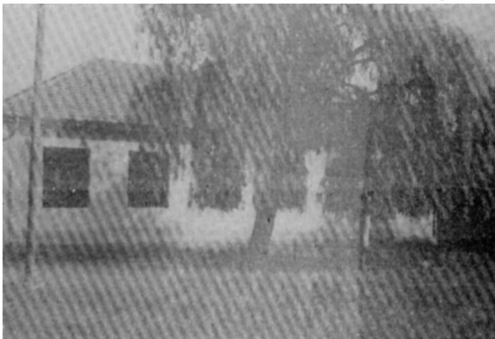
Училиштето во Доленци (1995 година)

Во учебната 1963/64 година училиштето во Ѓавато располагало со 4 згради, од кои 2 одговараат, а 2 не одговараат за настава, со вкупно 15 училници, од кои 8 одговараат, а 7 не одговараат, со вкупно 514 м 2 површина. Потоа, училиштето располагало и со 3 канцеларии со 78 м 2 , 1 кабинет со 12 м 2 , 1 библиотека со 32 м 2 , 2 сали со 244 м 2 , 1 трпезарија со 16 м 2 и 10 други простории со 250 м 2 . Исто така училиштето располагало и со 4 учителски станovi со 68 м 2 , два училишни двора со 2.450