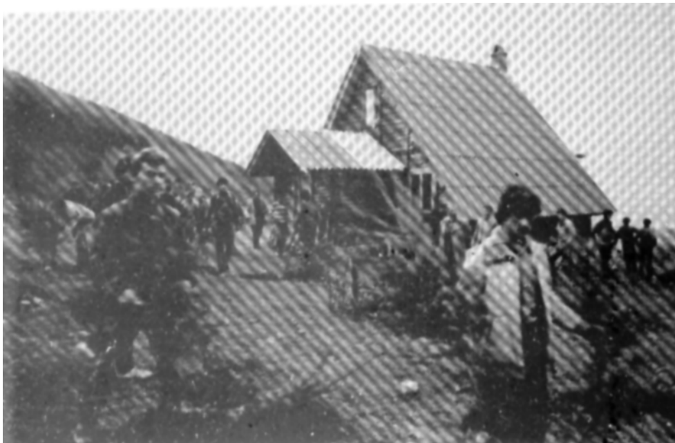
Извидничко-планинарската куќа од училиштето од с. Цапари