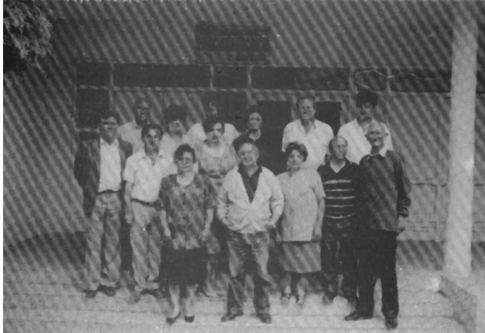
дел од вработените во ЦОУ „Трајан Белев“ с. Цапари, 1995 година