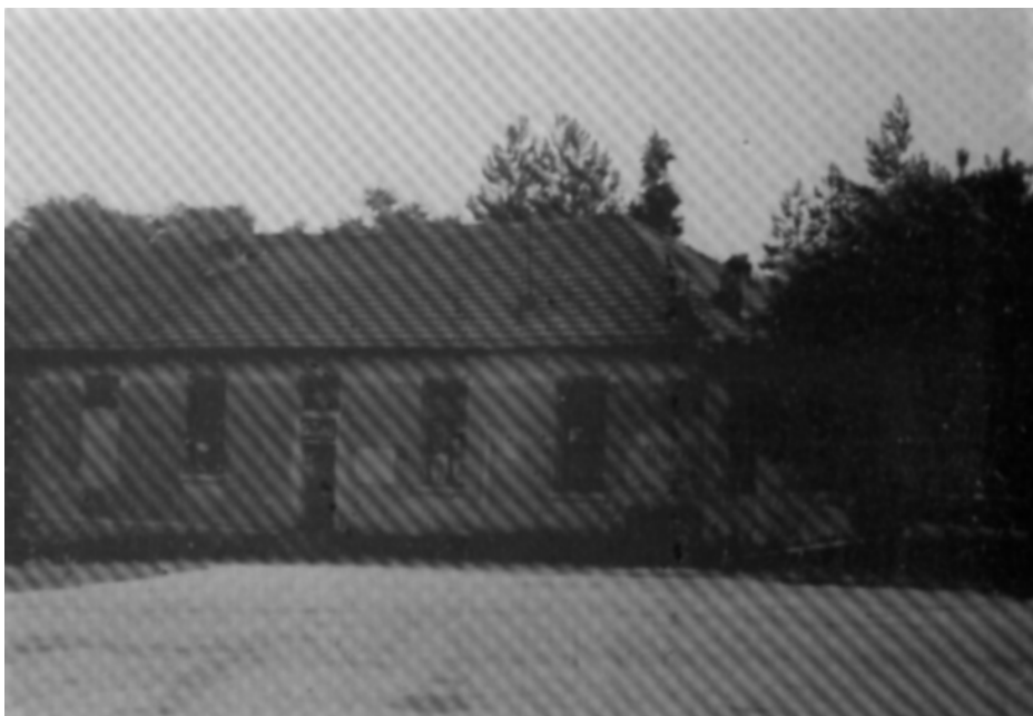
Училиштето во Ѓавато (1995 година)

простории, 1 канцеларија, сала за физкултура, 1 канцеларија за директорот и 2 визби. Си-те наведени простории не ги задоволуваат пот-ре-бите, па поради недостиг на простор наста-вата се изведува во две смени. Од инвентар училиштето