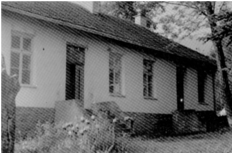
Училиштето во Ротино (1995 година)

Училиштето во Ротино е изградено во 1932 година и има 1 училница со 48 м 2 и канцеларија со 7,5 м 2 . Училиштето во Ротино од училиштето во