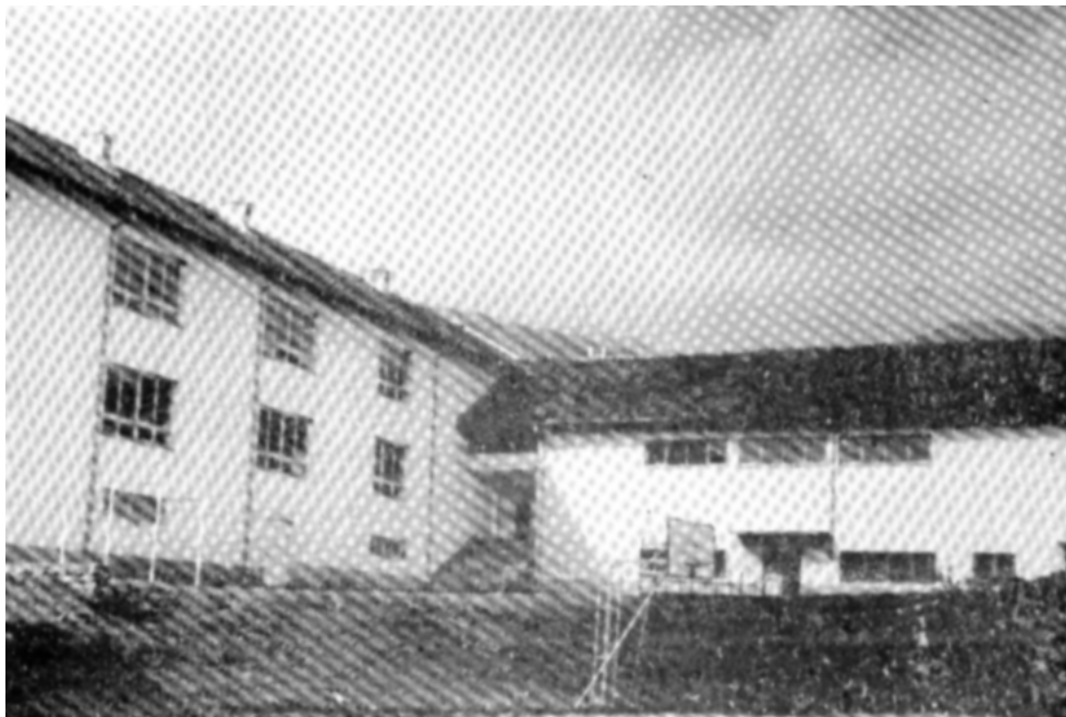
Спортската сала и полигонот при ЦОУ „Трајан Белев“ - Цапари (1995 година)

Кабинетска настава се изведува по повеќе предмети и тоа: историја, географија и ликовна култура во еден кабинет, руски јазик, македонски јазик и курсна настава по ППЗ во втор кабинет; биологија, хемија, музичка култура и курсна нас-