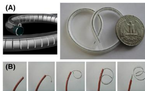
Слика бр. 1.(а) LiRIS® осмотски систем за продолжена испорака на лек во мочниот меур.(б) Употреба на уредот со катетер.

Мал и флексибилен осмотски систем кој може да се движи слободно во мочниот меур. LiRIS®-системот за интравезикално ослободување на лидокаин е во прва фаза на клинички испитувања за таргетирано лекување на интерстицијален циститис и синдром на болен мочен меур (Слика број 1).