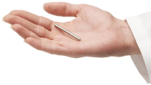
Слика број 4. DUROS® осмотски имплант

DUROS фармацевтските системи се минијатурни осмотски импланти кои може да го ослободуваат лекот во текот на 3 месеци до 1 година со прецизна кинетика од нулти ред. Овие системи се соодветни за потентни активни супстанции со капацитет до 500мг од еден имплант со волумен на резервоарот од 1 cm 3 . Со развојот на оваа технологија се потенцира јачината на лекот и воедно се обезбедува физичка и хемиска стабилност за подолг период на телесна температура. Напредните апликации на DUROS технологијата се во фаза на клинички и претклинички испитувања. DUROS осмотските импланти се системи кои работат како минијатурен шприц, вградени поткожно, од кои се ослободува соодветна количина од концентриран раствор на лекот со континуиран проток во текот на неколку месеци или години. Лекот, во облик на суспензија или раствор, е сместен во соодветен резервоар. Неопходно е овие формулации да покажуваат стабилност на телесна температура (37 °C) за подолги временски периоди, обично од 3 месеци до 1 година.