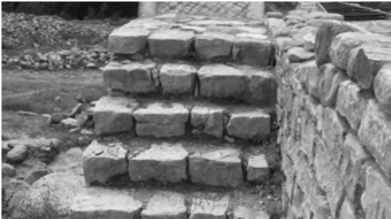
Сл.4 Скали поставени врз ниша 1 и 2 кои водат до бојната патека на северозападниот одбранбен ѕид