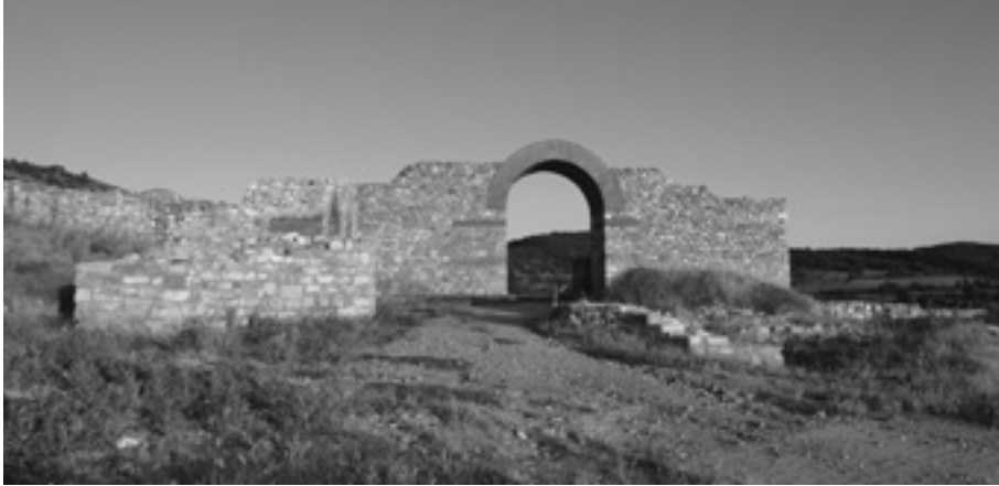
Сл.3 Порта Принципалис