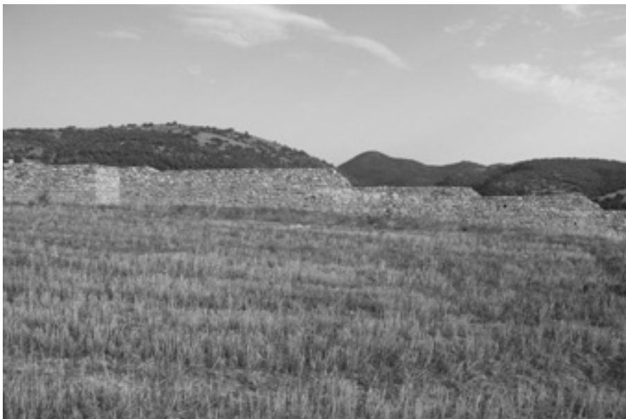
Сл.1 Северозападен одбранбен ѕид