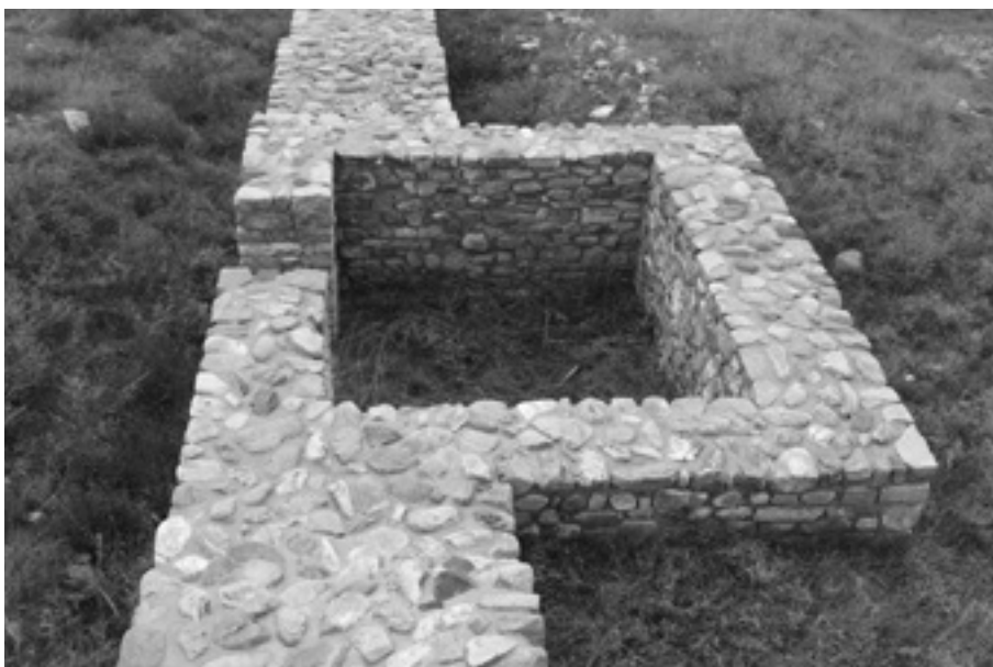
Сл.2 Правоаголна кула 2 од северозападниот одбранбен ѕид