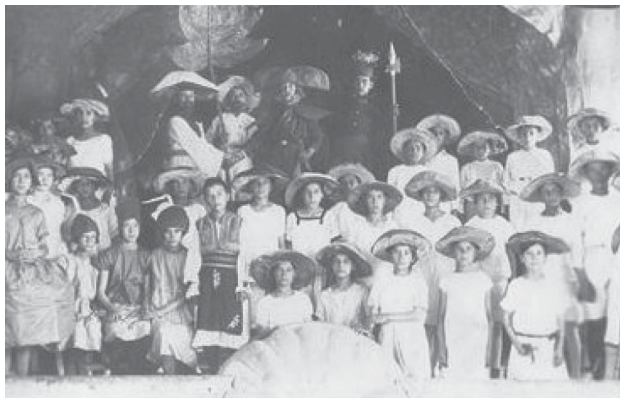
Сцена од операта „Печурки“