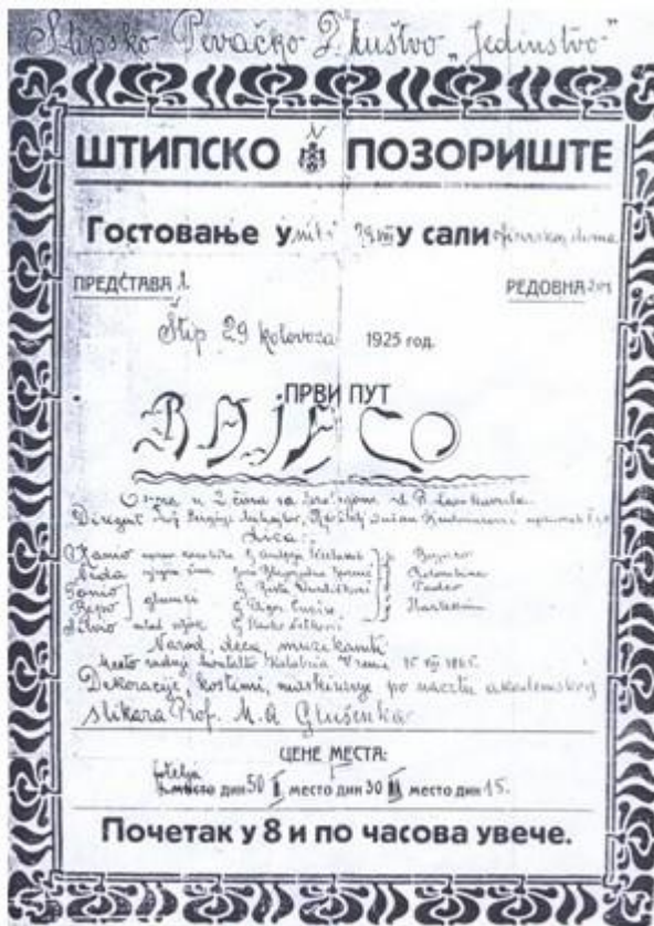
Оригиналниот ракописен плакат од првата изведба на „Палјачи“ во Штип 1925 година

Датум за паметење останува 29 август 1925 година, кога во салата на