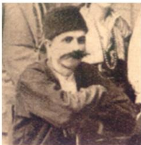
неговата улога во „Македонка“ изведена 1923 година