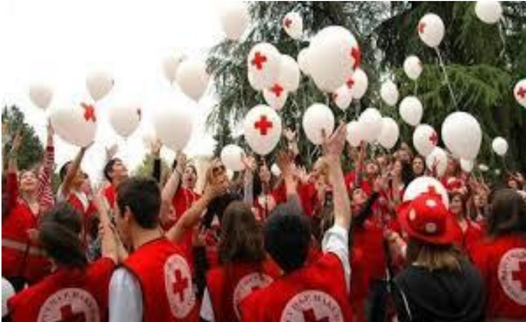
Табела 1. Преглед на планирани и реализирани крводарувања за периодот од 2000 до 2014 година во ООЦК Делчево

Применета е и анкета кај 90 испитаници, за мотивот за дарување на крв, со цел да се утврди главната мотивирачка причина за дарување на крв.