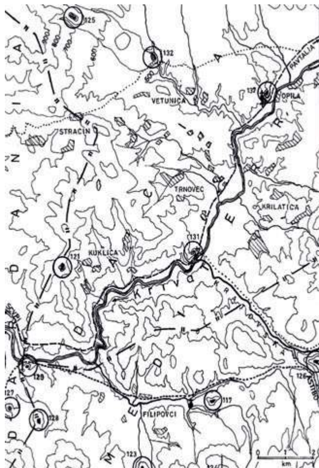
Карта со граници на провинциите Дарданија и Дакија Медитеранска и распоред на утврдувањата