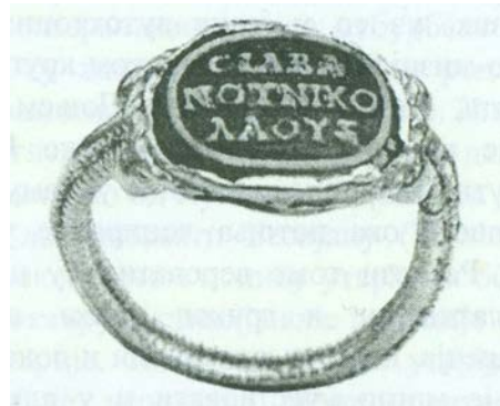
Сл. Прстен од Дрезга с.

Споменатиот Силван се чини дека на некој начин, по должност или со мандате, бил поврзан со станицата Ламуд, потврдена на локалитетот “Дрезга” во атарот на селото Лопате. 4 Имено, во текот на археолошките ископувања на некрополата од овој локалитет 5 во гробот 6/79 пронајден е златен прстен со полудраг камен со натпис СИЛΒΑΝΟΣ ΝΙΚΟΛΑΟΣ , кој го означува негови-от сопственик: Никола, син на Силван (Сл.2). Гробот прецизно е датиран според монетите од Максимин Даја. Ликиниј и Константин Велики, во втората и третата деценија од 4 век.