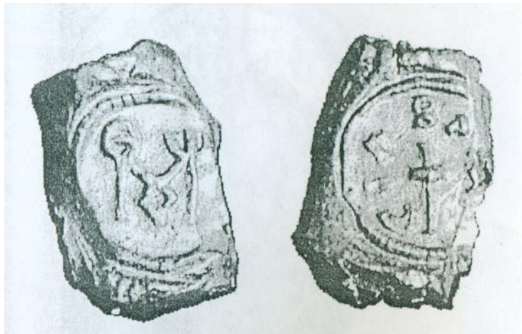
Сл. 1 Оловен печат од Давина Кула с.

И археолошките наоди афирмативно ги поврзуваат локалитетите од двете страни на Скопска Црна Гора. Пред сè тоа е еден оловен печат од Давина Кула (Сл. 1) кој на аверсот има натпис СИЛВАНОШСКЌ и крст во средината, а на реверсот можеби криптограм со иконографска претстава на градот ΘΟΜΕ ?