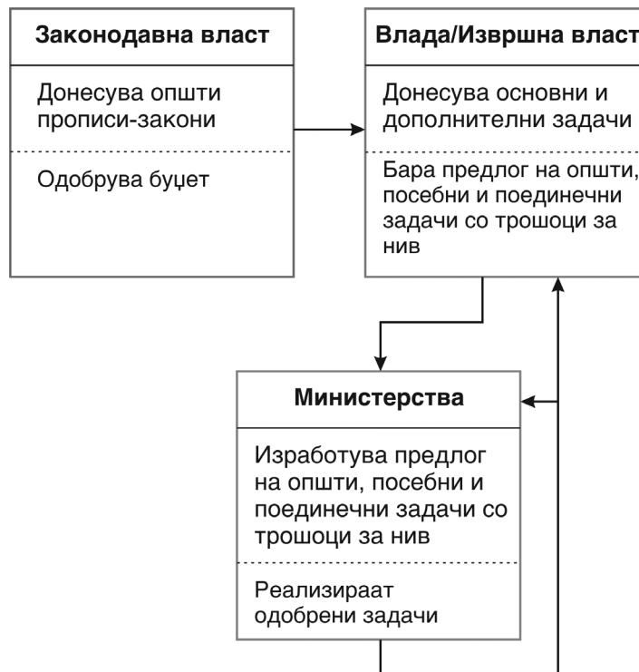
ШЕМА 1. Процес на изведбено планирање и буџетирање.