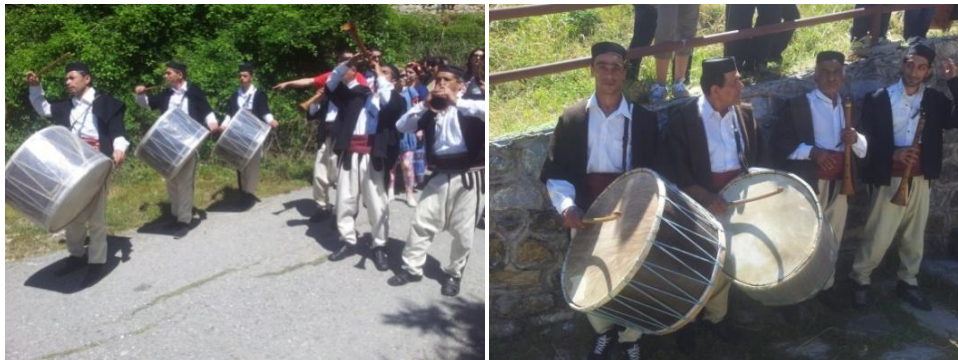
Фотографија 2 и 3. Зурлациско-тапанциски состави на Галичка свадба

Музичката придружба на овогодинашната Галичка свадба ја сочинуваа 5 зурли и 5 тапани од Дебар. До одреден момент зурлациите настапуваа заедно, а звучниот интензитет допринесуваше целиот настан да има посебен музичко-визуелен израз. По тргнувањето по невестата тие се одвоија во две групи, од кои, едната составена од три зурли и три тапана, а другата од две зурли и два тапана. Зурлациското семејство Мајовци од Дебар е традиционална музичка придружба на Галичката свадба. Зурлациите со кои имавме можност да зборуваме, велат дека свирењето на Галичка свадба било традиција на нивните фамилии и дека пред нив свиреле нивните татковци и дедовци (Фот. 2 и 3).