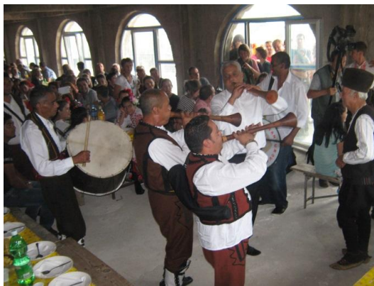
Фотографија 8. Свирење на зурли и тапани во чест на младоженците

Дел од свадбените обичаи се изведоа на сцена по што свадбарите придружени од зурлаците и тапаните одиграа заедничко оро пред бината на кое учествуваа и останатите учесниците на манифестацијата. Подоцна се придружи и блех-оркестарот, по што музиката ја изгуби смислата. По завршувањето на зедничкото оро, присутните беа поканети на традиционален ручек, кој се одржа во манастирски комплекс, во непосредна близина на Делчево. Овде веќе можеше да се почувствува топлината на свадбата, бидејќи официјално манифестацијата сè уште траеше со уште некои обичаи кои се изведуваа пред и околу ручекот. И овде свиреше зурлацкиот состав, кој имаше задача да ги развеселува младоженците, нивните блиски и останатите присутни гости (Фот. 8).