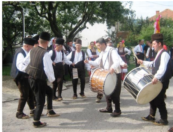
Фотографија 6. Орото „Копачка“ исполнето од мажи

Тапаните како мошне омилен инструмент во овој дел на Македонија допринесуваа во одржувањето на музичкиот континуитет. Целиот тек на свадбата (одење по невеста, земање на невестата) беше пропратен до Блех-оркестарот и составот од тапанци. Непосредно пред одењето кај невестата, уште еднаш се одигра орото Копачка, но овој пат само од мажи (Фотографија 6).