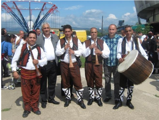
Фотографија 7. Зурлацки состав од Берово

натото. Зурлацкиот состав беше од Берово, составен од три зурли и два тапани (Фотографија 7). 3