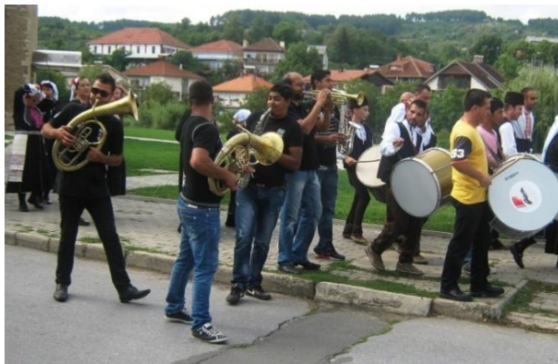
Фотографија 4. Оркестар од лимени дувачки инструменти

Пијанечко-малешевската свадба како организирана манифестација од страна на Општина Делчево има за цел да ја популаризира свадбата од минатото во овој регион. Свadbата како настан не беше организирана поединечно, а самата манифестација опфаќаше и настапи на културно-уметнички друштва кои на организирана сцена презентираа дел од нивниот играчки репертоар. Свadbата отпочна од центарот на градот каде што и заврши со заедничко оро на сите учесници. Ние нема да го опишуваме целиот тек на свadbата, туку ќе ја опфатиме музиката придружба која беше присутна на свadbата. На Пијанечко-малешевската свадба за разлика од Галичката, имаше три типа на музика. Првата музика беше составена од лимени дувачки инструменти, на кои свиреа Роми од Делчево, а кои се несвојствени за македонската музичката традиција (Фотографија 4). 2