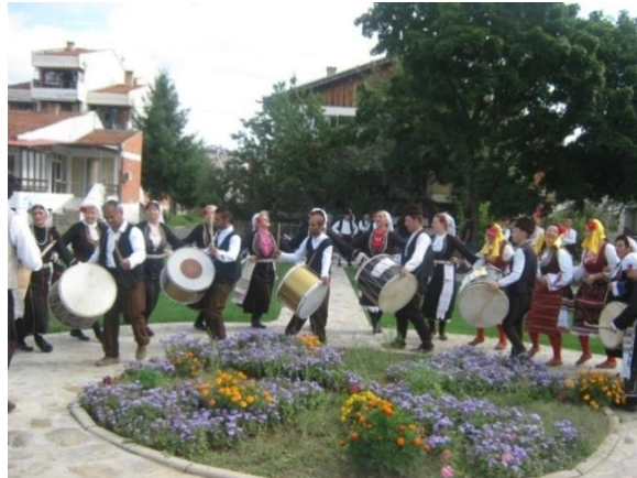
Фотографија 5. Орото „Копачка“ во придружба на тапани

дружните обичаи. Во придружба само на тапани, жените кои беа дел од свадбената поворка го изведоа орото Копачка, оро карактеристично за Пијанечкиот крај (Фотографија 5).