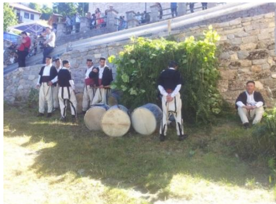
Фотографија 1. Колиба од гранки за одмор на свирачите