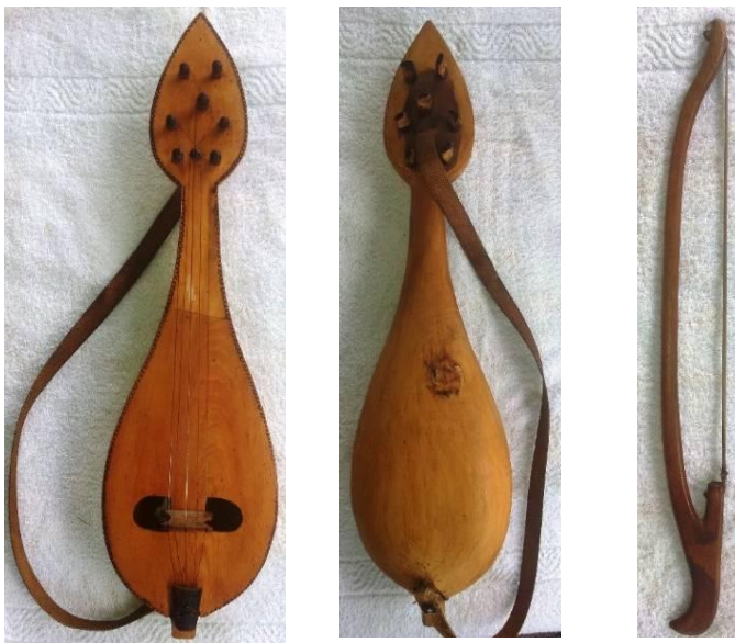
Фотографија 1. Гуслата во сопственост на Станко (предна и задна страна) и гудало

не ги користел и гуслата останува со три жици и две резонаторни жици на кои што тој свири и ден-денес (Фотографија 1).