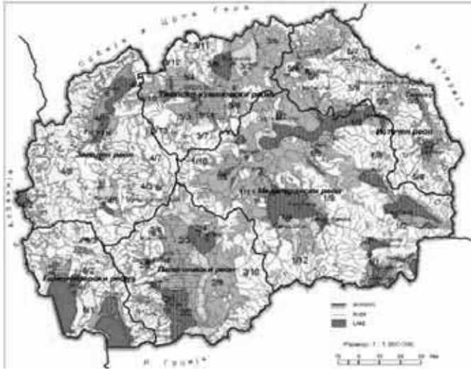
Slika 1. Poljoprivredni regioni Republike Makedonije Figure 1. Agricultural regions of the Republic of Macedonia

Prema procenama u Republici Makedoniji ima oko 14000-15000 raznih mašina za aplikaciju pesticida, na kojima treba izvršiti inspekciju do 2020 godine, a zatim nastaviti proveru ispravnosti na svake 3 godine. Mora se istaći da je 80% mašina starije od 20 godina, tako da je zbog amortizovanosti i raznih neispravnosti njihova upotreba veoma opasna kako za same rukovaoce tako i za okruženje.